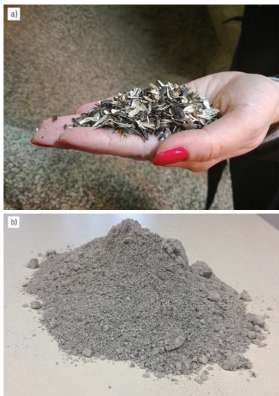
Slika 3. a) Suncokretove ljuske; b) Biopepeo od spaljivanja suncokretovih ljusaka

Udio biomase kao obnovljivog izvora u proizvodnji ukupne energije sve je veći. Spaljivanjem biomase u termoelektranama nastaju velike količine pepela koji treba ponovno upotrijebiti. Nastali pepeo najčešće se odlaže na odlagalištima otpada, a s obzirom na trend povećanja udjela obnovljivih izvora u cjelokupnoj proizvodnji energije, količine nastalog pepela sve se više gomilaju. Povoljna fizikalna i kemijska svojstva biopepela, kao i pozitivna iskustva primjene pepela od izgranja ugljena, potaknula su i sve brojnija istraživanja primjene biopepela u građevinarstvu. Provedena su istraživanja pokazala da biopepeli znatno variraju u svom sastavu i svojstvima ovisno o porijeklu biomase, rukovanju biomasom, načinu i temperaturi spaljivanja. Velik raspon svojstava znači i brojne mogućnosti primjene biopepela u cestogradnji kao zamjene tradicionalnim materijalima. Kemijski sastav biopepela, osobito udio \text{CaO} i pucolana, upućuje na mogućnost djelomične ili potpune zamjene