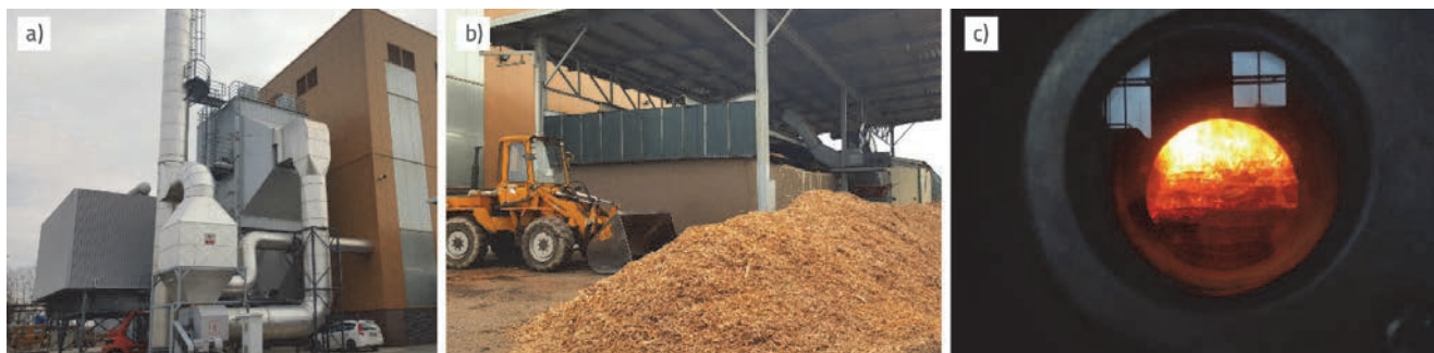
Slika 2. a) Prva privatna elektrana na biomasu u Hrvatskoj; b) Spaljivana sječka, c) Izgaranje biomase [55]

biomase kao obnovljivog izvora energije u Hrvatskoj je vrlo velik s obzirom na to da se 48 % njezina teritorija nalazi pod šumama [4]. Osim toga, može se upotrijebiti dio poljoprivrednog ostatka poput slame, ljušaka suncokreta, maslinove komine te ostataka obrezivanja vinograda i voćnjaka [5]. Dok upotreba biomase za energiju u svijetu neprekidno raste, u Hrvatskoj su tek u zadnjih nekoliko godina izgrađene prve termoelektrane na biomasu (Slika 2.). U njima se za energiju spaljuje tek drvena biomasa nastala u industriji prerade drva i ostaci šumarske industrije, a spaljivanje se u većini slučajeva odvija u pećima s izgaranjem na rešetki. No, postoje planovi za povećanjem korištenja energije iz biomase te se planira u pogon pustiti 55 elektrana s instaliranom snagom od 93,97MW [54]. Povećanje ovih kapaciteta podrazumijeva i pronalaženje prihvatljivog načina postupanja s nastalim pepelom.