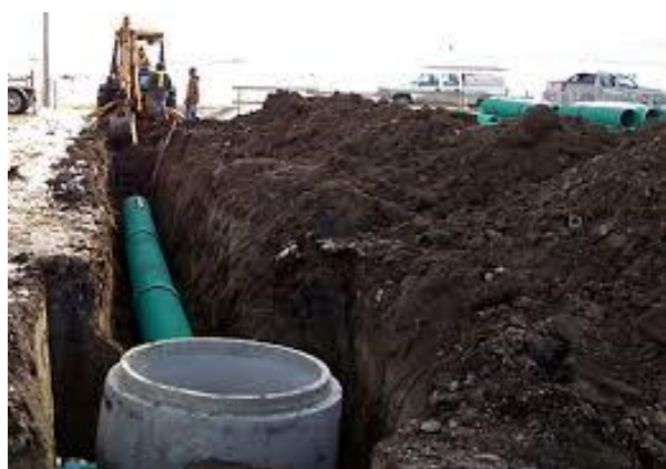
Slika 5. Postavljanje nove cijevi [33]

Drugi način fizičke kontrole je zamjena cijevi (slika 5). Pod zamjenom cijevi smatra se uklanjanje starih, oštećenih cijevi i zamjena novim [18].