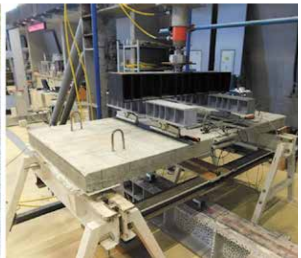
Ploča ispitana na proboj (lijevo) i statičko ispitivanje ploče (desno)