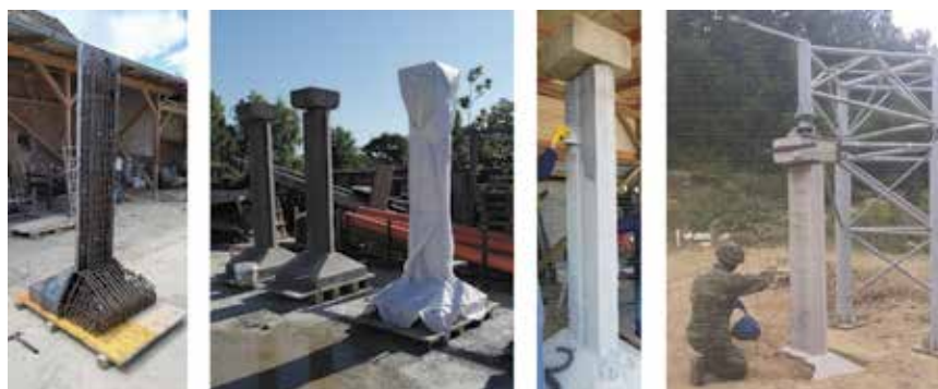
Izvedba, njega i nanos ojačanja na stupove (lijevo i sredina) te postav za treću fazu eksperimenta (desno)

Prema planu istraživanja pregledana je arhivska građa Hrvatskih cesta i Hrvatskih autocesta te su iz dostupnih projekata izdvojeni podaci o stupovima nadvožnjaka. Na temelju prikupljenih podataka izvedeni su preliminarni numerički modeli u Ansys Autodyn, softveru s mogućnošću