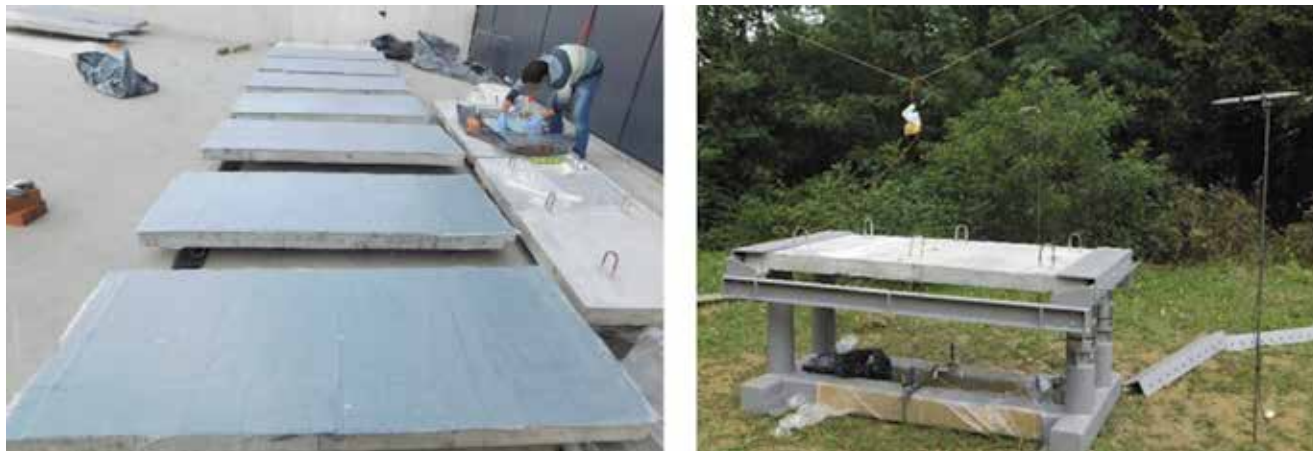
Nanos ojačanja na AB ploče (lijevo) i postavljanje instrumenata za drugu fazu eksperimenta (desno)

Tijekom prve faze eksperimentalnoga programa određuju se parametri eksplozije, a sastoji se od detoniranja prethodno određene količine eksploziva te mjerenja upadnih i reflektiranih tlakova zraka. Osim utjecaja mase i udaljenosti na tlakove eksplozije promatran je i utjecaj oblika eksplozivnoga naboja na tlak. Tijekom druge faze eksperimentalnoga programa provjeravaju se tri predložene metode ojačanja stupova kako bi se dobio uvid u učinkovitost povećanja otpornosti na djelovanje eksplozije. Izvedeno je ukupno 12 armiranobetonskih ploča. Tri su ploče ostavljene kao obične armiranobetonske, dok je na ostalih osam ploča nanoseno ojačanje. Kao ojačanje AB ploče upotrijebljena je staklena tkanina, i to u obliku pletene tkanine i suho lijepljene tkanine. Tkanina je lijepljena na ploče epoksidnim ljepilom. Nakon aplikacije ojačanja ploče su transportirane na poligon te deponirane na mikrolokaciji na kojoj je prethodno postavljena čelična potporna konstrukcija koja je služila za pridržavanje ploča tijekom ispitivanja. Naboj je pri ispitivanju bio ovješten iznad ploče te centriran kako bi se ploča ravnomjerno izložila djelovanju eksplozije. Tijekom ispitivanja nekoliko instrumenata postavljeno je na ploču te u njezinoj okolini kako bi se promatralo ponašanje pri djelovanju eksplozije.