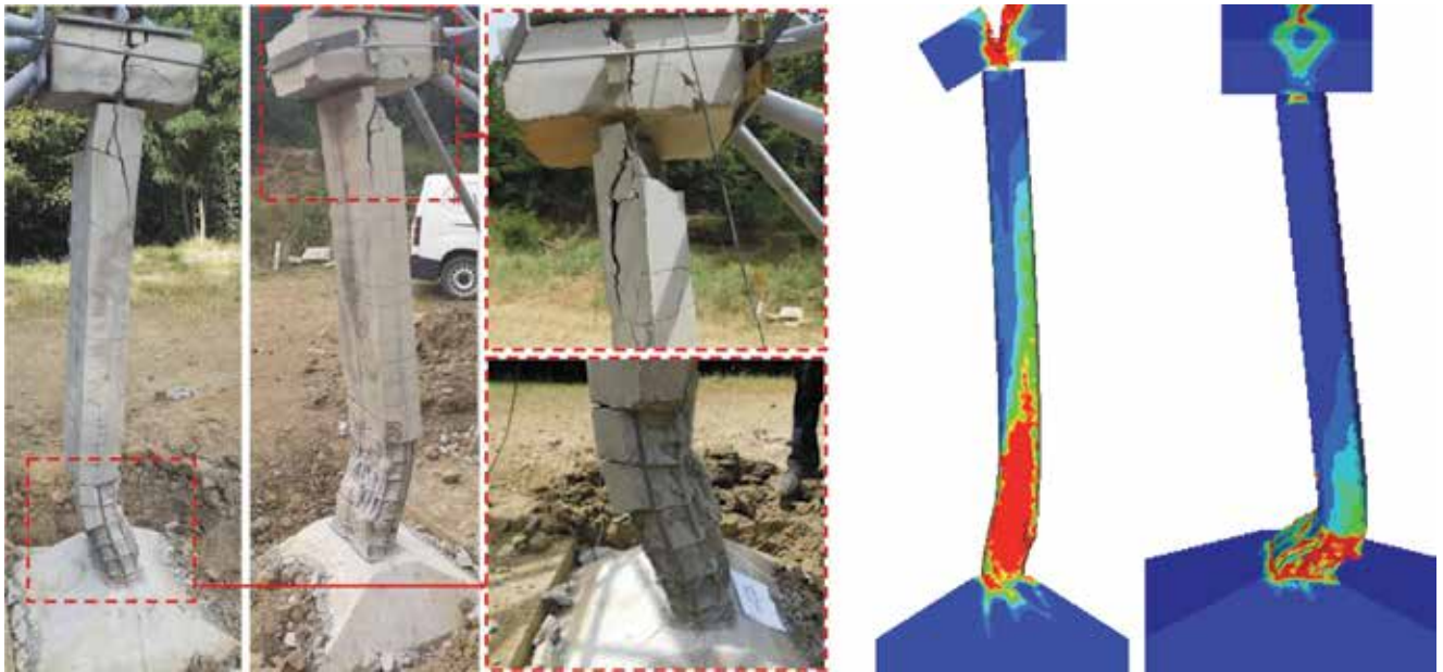
Usporedba oštećenja stupova između eksperimentalnih (lijevo) i numeričkih rezultata (desno)

rimentalnih istraživanja u toj fazi može se zaključiti da mjesto postavljanja eksploziva ima važnu ulogu u intenzitetu oštećenja stupa. Kada je eksploziv postavljen kontaktno, oštećenje koje se javlja je veće, ali je lokalnoga karaktera, dok eksploziv postavljen na neku udaljenosti od stupa, osim lokalnog, oštećenja (posmika, ljuštenja, otpadanja betona), globalno oštećuje stup (savojne pukotine, zakrivljenost stupa). Također, ojačanje stupa ima važnu ulogu u smanjenju razine oštećenja.