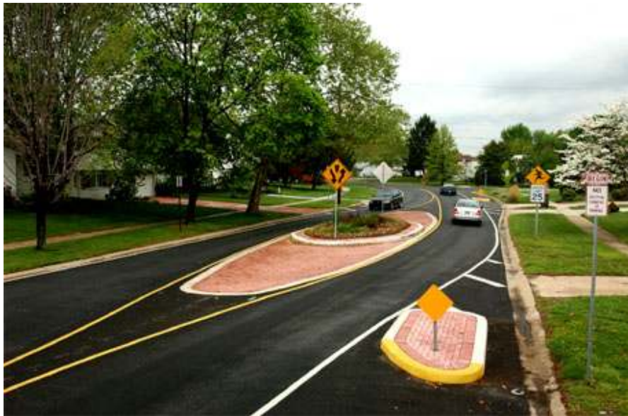
Slika 3 - Primjer razdvajanja smjerova vožnje izvođenjem prometnih otoka [5]

Sva rješenja problema ugroženosti nezaštićenih sudionika u prometu trebaju biti, u danim uvjetima, tehnički izvediva i jeftina te ne smiju ići na štetu ograničavanja propusne moći prometnice i pokretljivosti svih sudionika. Naime, ako je rješenje neudobno, motorizirani sudionici bi mogli početi izbjegavati određenu dionicu, a u tom slučaju bi svako smirivanje prometa izgubilo smisao jer bi postalo zabrana, nikako rješenje uvjetovanog kretanja.