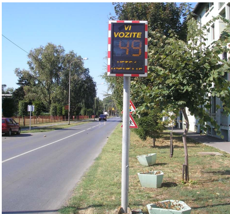
Slika 6 - Smirivanje prometa uređajem za određivanje brzine vožnje

prometnih trakova otocima, prenamjena dijela vozne površine u parkirnu, zamjena klasičnih raskrižja kružnima i slično, a sve radi prisiljavanja vozača na tzv. slalomsku vožnju i smanjenje brzine.