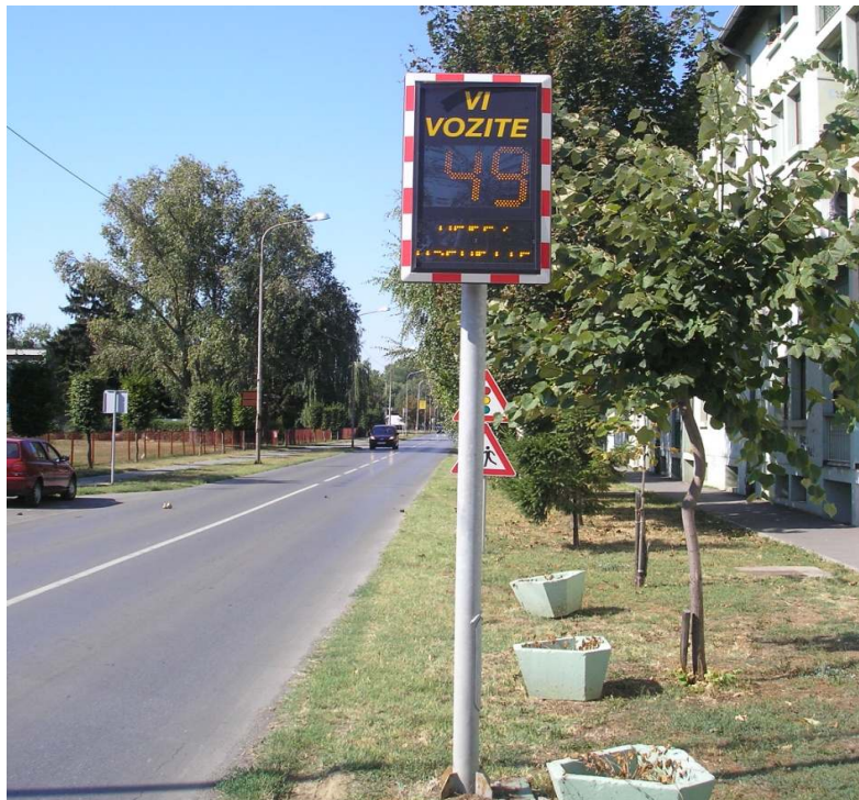
Slika 6 - Smirivanje prometa uređajem za određivanje brzine vožnje

prometnih trakova otocima, prenamjena dijela vozne površine u parkirnu, zamjena klasičnih raskrižja kružnima i slično, a sve radi prisiljavanja vozača na tzv. slalomsku vožnju i smanjenje brzine.