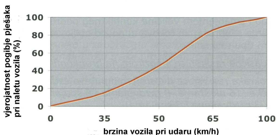
Slika 1 - Utjecaj brzine vožnje na vjerojatnost pogibije pješaka prilikom sudara [2]

Razvitak prometa te visok stupanj motorizacije, uz sve važne prednosti u zadovoljenju potreba mobilnosti stanovnika u gradovima, izaziva i negativnosti među kojima se posebno ističu prometne nesreće. S jedne strane postavlja se zahtjev za pokretljivošću i što većom brzinom, a s druge strane upravo velika brzina kretanja ugrožava sigurnost sudionika u prometu, posebno pješaka, biciklista, djece i hendikepiranih osoba. Brojna istraživanja [1, 2] potvrdila su vrlo usku vezu između brzine kretanja vozila i težine posljedica (povreda) za pješake i bicikliste u prometnim nesrećama. Prema domaćim istraživanjima [1] granična brzina pri kojoj nema težih posljedica za nezaštićene sudionike u prometu iznosi 30 km/h. Na temelju provedenih inozemnih istraživanja [2], graničnu brzinu između nastanka lakših i težih povreda pješaka i biciklista prilikom nalijetanja vozila čini brzina vožnje od 36 km/h (slika 1).