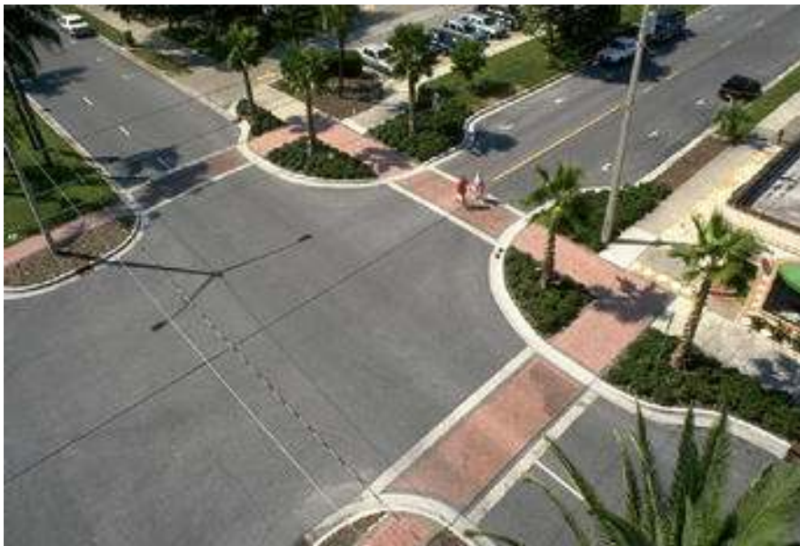
Slika 4 - Primjer suženja vozne i proširenja pješačke površine [6]