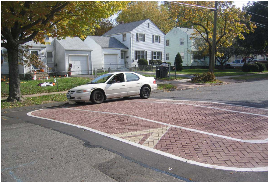
Slika 5 - Izdignuće na kolniku izvedeno kombinacijom asfalta i betonskih elemenata [7]

Uz sve navedene mogućnosti smirivanja prometa, i dalje se razmišlja o učinkovitim i jeftinim načinima smirivanja prometa pa je tako jedno neuobičajeno, a zanimljivo rješenje moguće vidjeti u manjim austrijskim mjestima gdje je ispred pješačkih prijelaza i škola postavljen dvodimenzionalni lik policajca u pravoj veličini.