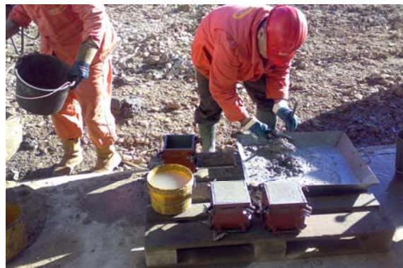
Slika 2. Uzimanje uzoraka za ispitivanje tlačne čvrstoće