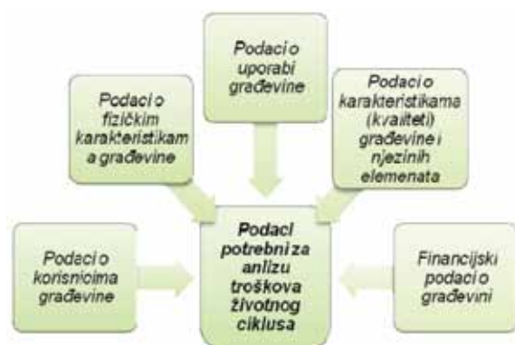
Slika 3. Skupine podataka potrebnih za provedbu analize troškova životnog ciklusa [21]

Više je razloga za nepostojanje jedinstvenog modela izračuna troškova životnog ciklusa, a neki su od njih svakako postojanje različitih sustava prikupljanja i obrade podataka o troškovima održavanja i uporabe građevine te postojanje vrlo različitih