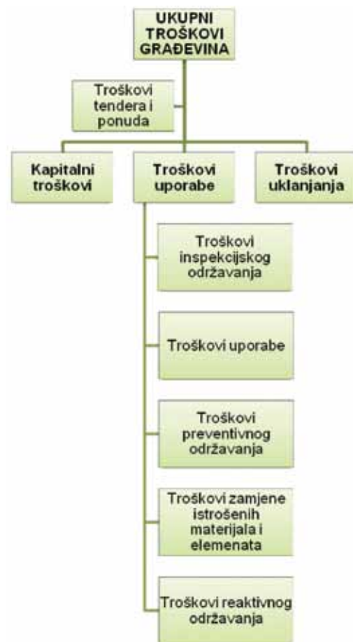
Slika 2. Kategorije ukupnih troškova [2, 20]

slici 3., a svaki od njih na različiti način i u različitom razdoblju utječe na navedene troškove građevina [21].