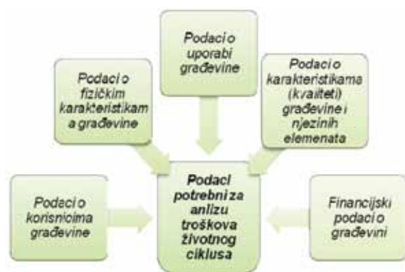
Slika 3. Skupine podataka potrebnih za provedbu analize troškova životnog ciklusa [21]

Više je razloga za nepostojanje jedinstvenog modela izračuna troškova životnog ciklusa, a neki su od njih svakako postojanje različitih sustava prikupljanja i obrade podataka o troškovima održavanja i uporabe građevine te postojanje vrlo različitih