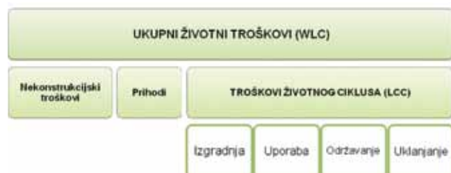
Slika 1. Struktura ukupnih životnih troškova i troškova životnog ciklusa [16]

Smatra se kako šira uporaba metode troškova životnog ciklusa ima dvije velike prepreke, a to su nedostatak pouzdanih podataka o povijesnim troškovima građevina i načinu uporabe i nepostojanje učinkovite metode za kontrolu analize troškova [17]. Građevine su različite, izgrađene na raznim lokacijama i s različitim namjenama, pa su stoga prikupljanje i obrada podataka izuzetno otežani. Nadalje, ne postoje standardizirane metode prikupljanja i obrade podataka, a to otežava kontrolu podataka dobivenih analizom [11, 17, 18].