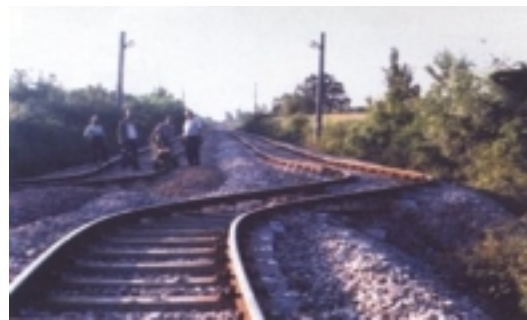
Slika 3. Željeznička pruga prekinuta rasjedom otvorenim u potresu Kocaeli

http://www.itu.edu.tr/depem/rapor/depem.html