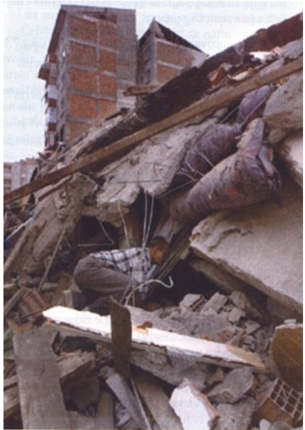
Slika 12. Oštećenja loše izvedene zgrade u bloku sa dobro izvedenim zgradama

Da bismo učili na tuđim pogreškama i izbjegli neugodna iskustva kao što su ova iz potresa 1999. godine, nužno bi bilo prije potresa detektirati i zatim pojačati potencijalno opasne objekte. Zato bi trebalo napraviti pregled