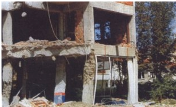
Slika 6. Oštećenja loše projektirane i loše izvedene okvirne konstrukcije

Većinu okvirnih nosivih sustava čine relativno jake grede i slabi stupovi, tako da do plastificiranja zglobova dolazi u stupovima, pretvarajući nosivi sustav u katni mehanizam i izazivajući rušenje u kojem se stropne konstrukcije slažu jedna na drugu. U takvim slučajevima, stupovi na kutovima objekta su pretrpjeli velika oštećenja. Gornja i donja uzdužna armatura je u području čvorova okvira bila izložena velikim zatežućim silama zbog izmjeničnih potresnih momenata. Nosivost čvorova je poradi nedostatka vilica najčešće bila premalena da preuzme nastale sile te je dolazilo do drobljenja betona, izvijanja i tečenja uzdužne armature. Ostali nepovoljni detalji su: nedovoljna dužina sidrenja armature, nedovoljni preklopi armature, izvedba vilica bez sidrenja slobodnih krajeva, djelomična ispuna okvira te najčešće kombinacija nabrojanih nedostataka. Na slici 6. pokazana su oštećenja jedne loše zamišljene i loše izvedene okvirne konstrukcije.