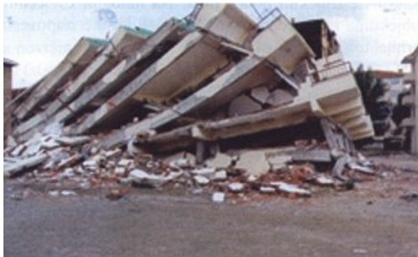
Slika 9. Primjer rušenja kuće s mekim katovima http://www.its.caltech.edu/~avhan/EQ/Golcuk.html

Iako se meko prizemlje ponekad izvodilo namjerno, zato da bi se energija unesena potresom potrošila u gibanju objekta, jednom kad je granično opterećenje dosegnuto, dolazi do plastificiranja zglobova u stupovima, nosivi se sustav pretvara u mehanizam i objekt se ruši. Posebno tome pridonose nesimetrije u tlocrtu, tj. udaljenost središta krutosti od središta masa koje pojačavaju torzijsko djelovanje potresnih opterećenja i povećavaju opterećenje na mekše elemente. Pojavu popuštanja vertikalnih elemenata svih katova dobro ilustrira slika 9.