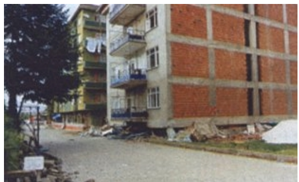
Slika 8. Oštećenje zgrade zbog mekog prizemlja

U središtu potresom pogođenih gradova, posebno u trgovačkim ulicama, veliki broj zgrada srušio se prema ulici, zbog popuštanja stupova prizemlja s ulične strane. Kao i u mnogim hrvatskim gradovima, ulična strana prizemlja pretvorena je u izlog, dok je s unutarnje strane zgrade, kao i na višim katovima, zadržano teško žiđe. Efekt je najčešće bio pojačan i rasporedom pregradnih zidova u smjeru okomito na ulicu. Time je uvedena nesimetrija u raspodjeli krutosti po tlocrtu i visini objekta. Relativni katni pomaci bili su preveliki (P- \Delta efekt) i to je najčešće rezultiralo rušenjem konstrukcije. Pojava mekih katova je bila naročito naglašena kod objekata sa višim prizemljem. Nedostatak armiranobetonskih posmičnih zidova ubrzao je konstruktivne i nekonstruktivne štete nastajanjem plastičnih zglobova na krajevima stupova. Primjer rušenja zbog drobljenja mekog prizemlja prikazuje slika 8.