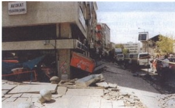
Slika 4. Utonuće zgrade zbog gubitka nosivosti tla

Utvrđena je bitno veća oštećenost objekata temeljenih na mekom tlu, u odnosu prema onima na stijeni. Štete uključuju velike deformacije temeljnog tla, štete na nosivoj konstrukciji, a ozbiljnost šteta na objektu općenito raste sa prisutnošću velikih deformacija tla na lokaciji.