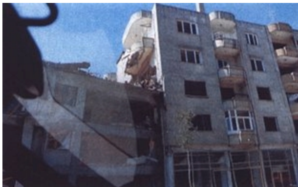
Slika 10. Oštećenje zgrade s nedovoljno širokom potresnom razdjelnicom

Sudaranje susjednih građevina događa se tijekom potresa ako seizmička razdjelnica nije dovoljno široka ili čak uopće nije izvedena. Nepovoljniji slučaj nastaje kada visine katova susjednih objekata nisu jednake, što rezultira u sudaranju po visini stupa. Iako turski propisi reguliraju širinu razdjelnice na 3-5 cm, u stvarnosti to najčešće nije primijenjeno. Primijećeno je dosta oštećenja uzrokovanih ovim efektom (slika 10.).