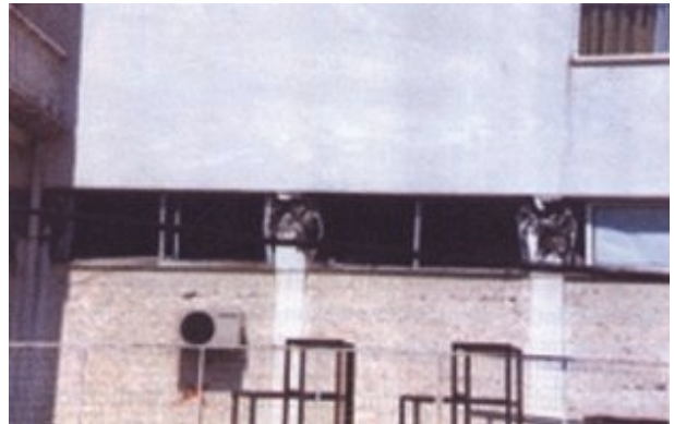
Slika 7. Oštećenje kratkih stupova

objektima primijećeno je da su imali kratke stupove iz arhitektonskih razloga.