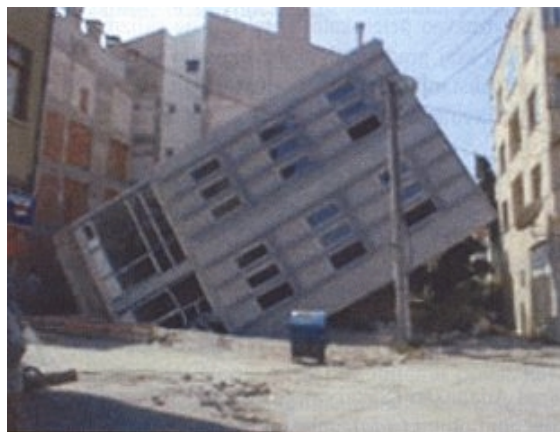
Slika 5. Naginjanje zgrade zbog likvefakcije tla pod temeljnom pločom

Uzdizanje pločnika ili površine terena oko mnogih temelja (slika 4.) može se objasniti gubitkom nosivosti tla, tj. slomom tla pod temeljem. Mnogi slučajevi tonjenja, naginjanja i pomicanja zgrada (slika 5.) povezani su s ključanjem tla ( sand boiling ) – to je istjecanje omekšanog tla i vode na površinu terena, translacijom tla ( lateral spreading ), te su očito posljedica likvefakcije temeljnog tla. Likvefirano je tlo uglavnom prašnasti pijesak sa 5 do 40 % sitnih čestica. Ove su zgrade uglavnom temeljene plitko – dubine oko 1 m. Neke od ovih pojava upozoravaju na važnost promjena svojstava tla tijekom potresa, posebno pod utjecajem opterećenja od objekata. Na mnogim građevinama bez vidljivih promjena u temelj-