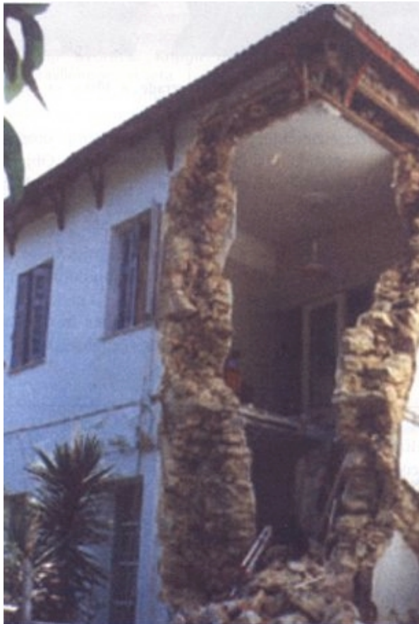
Slika 11. Rušenje kuta zidane zgrade bez horizontalnih ukruta http://www.eeri.org/Reconn/Greece1099/Greece1099-3.html

Stradale su mnoge zidane zgrade građene u prvoj polovini stoljeća, i to zgrade od nabijene zemlje i zgrade zidane neobrađenim kamenom. Česta su rušenja vanjskih zidova, uglova zgrada (slika 11.), odvajanja zidova na uglovima zgrada te otvaranje pukotina u zidovima. Zidane zgrade od cigle sa serklažima i betonskim krovnim pločama, sagrađene u novije vrijeme, ponašale su se dobro. Izuzetak čine zidane zgrade kojima su nadograđeni jedan