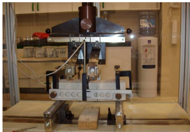
Slika 5. Odnos opterećenje-deformacija