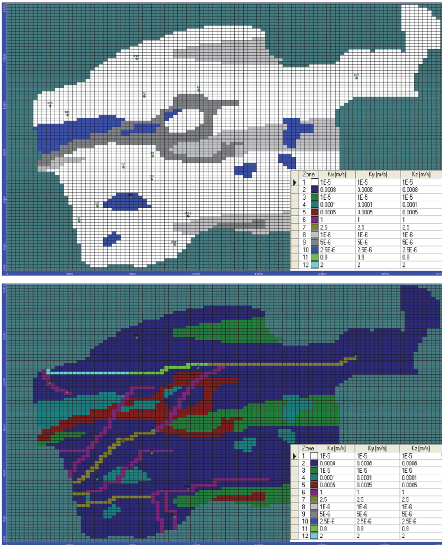
Slika 3. Prostorna raspodjela koeficijenta hidrauličke vodljivosti na gornji sloj (iznad) i donji sloj (ispod)

Rezultati usporedbe razina podzemnih voda između modeliranih i izmjerenih vrijednosti na piezometrima P2, P5 i S7 prikazani su na slici 4. Razlika između modeliranih i izmjerenih vrijednosti razina podzemne vode nalazi se unutar kalibracijskog kriterija od plus, minus 1,5 m [10].