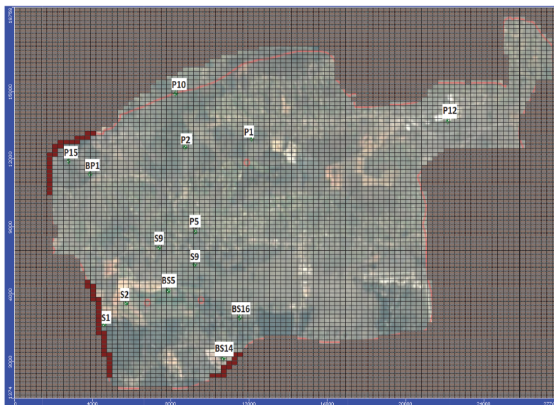
Slika 2. Prostorna domena vodonosnika “Bokanjac – Poličnik” unutar modela Modflow, lokacije piezometara i rubnih uvjeta korištenih u kalibraciji

Sliv “Bokanjac – Poličnik” predstavljen je ortogonalnom mrežom s ćelijama dimenzija 200 x 200 m u horizontalnoj ravnini (slika 2.) te s dva sloja u vertikalnom smjeru. Donji sloj je debljine 1 m (od -2 m n. m. do -1 m n. m.), a gornji 101 m (od -1 m n. m. do 100 m n. m.). Kalibracija se odnosi na period od 29. siječnja do 30. lipnja 1967. (153 dana), oslanjajući se na izmjerene razine podzemne vode u piezometrima P1, P2, P5, P10, P12, P15, BP1, S1, S2, S7, S9, BS5, BS14, BS16 (slika 2). Upotrijebljeni su podaci dnevnih oborina s ombrografske stanice smještene unutar analiziranog područja. Primijenjena je vrijednost koeficijenta infiltracije od 0,6 [9]. Vremenske serije razina podzemnih voda s piezometara P15, S1 i BS14 služile su kao rubni uvjeti modela (slika 2.). Parametrizacija modela u smislu određivanja prikladnih vrijednosti hidrauličke vodljivosti k_{x,y,z} , efektivne poroznosti n_{eff} i ukupne poroznosti n_{tot} usvojena je na temelju kalibracijskog procesa, a vrijednosti su prikazane na slikama 3 i 4 te u tablici 1. Velike brzine javljaju se u donjem sloju, gdje su zadane veće vrijednosti koeficijenta provodljivosti s ciljem simulacije pukotina kroz koje protječe većina toka.