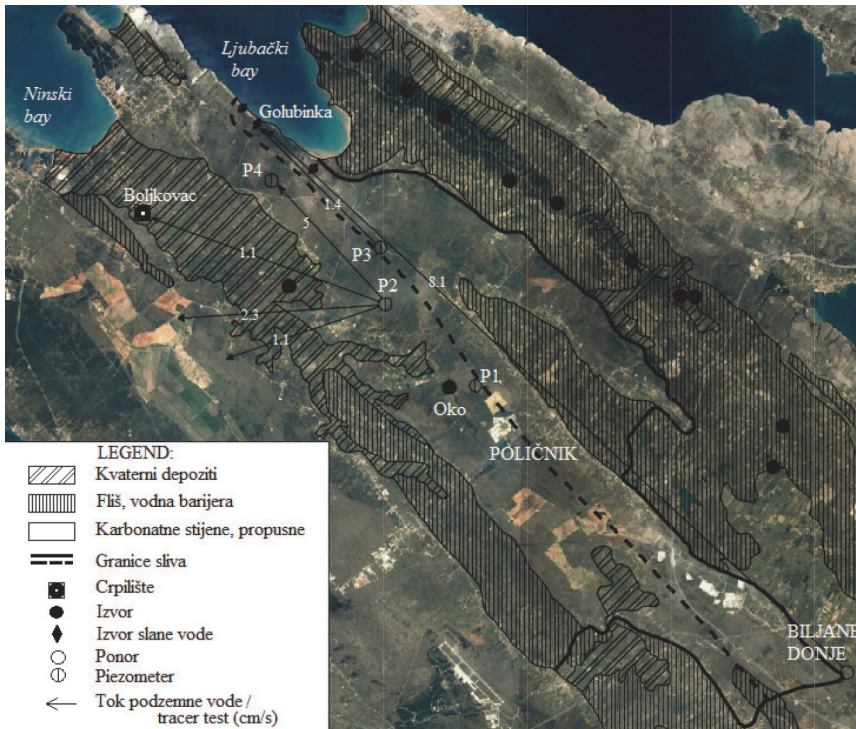
Slika 1. Hidrogeološka karta sjevernog dijela sliva "Bokanjac – Poličnik"