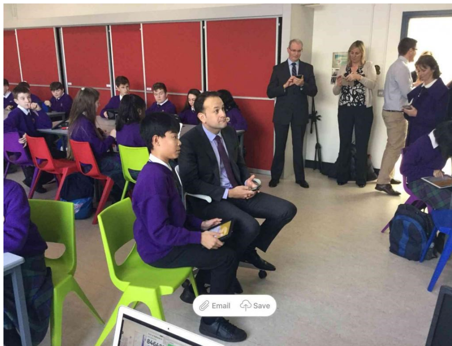
Slika 10. Prostori za učenje, škola Le Chéile, Irska