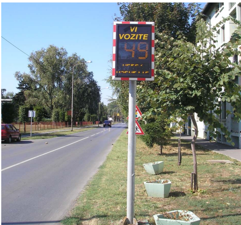
Slika 6 - Smirivanje prometa uređajem za određivanje brzine vožnje

prometnih trakova otocima, prenamjena dijela vozne površine u parkirnu, zamjena klasičnih raskrižja kružnima i slično, a sve radi prisiljavanja vozača na tzv. slalomsku vožnju i smanjenje brzine.