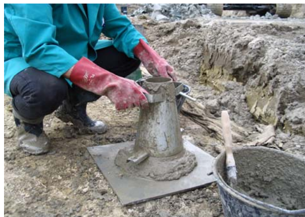
Slika 1. Ispitivanje svježeg betona metodom slijeganja