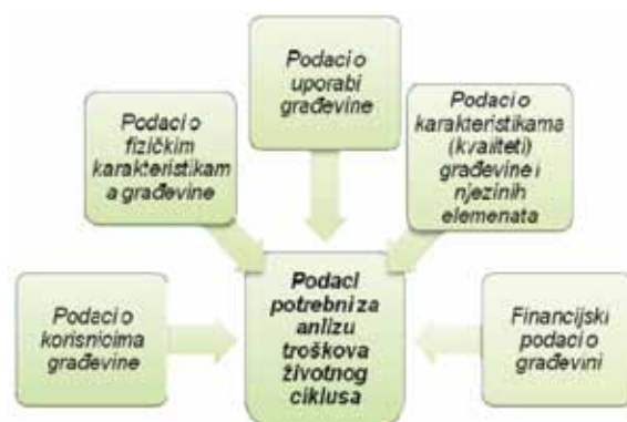
Slika 3. Skupine podataka potrebnih za provedbu analize troškova životnog ciklusa [21]

Više je razloga za nepostojanje jedinstvenog modela izračuna troškova životnog ciklusa, a neki su od njih svakako postojanje različitih sustava prikupljanja i obrade podataka o troškovima održavanja i uporabe građevine te postojanje vrlo različitih