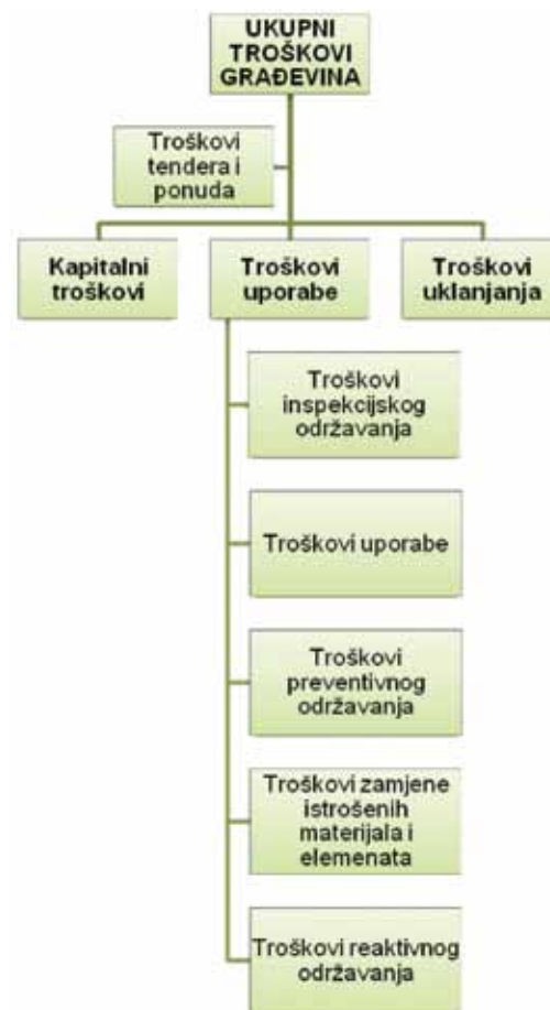
Slika 2. Kategorije ukupnih troškova [2, 20]

slici 3., a svaki od njih na različiti način i u različitom razdoblju utječe na navedene troškove građevina [21].