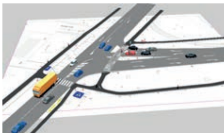
Slika 7. Prikaz nesemaforiziranog raskrižja u VISSIM-u [14]

Na Slikama 7 – 9 prikazani su modeli raskrižja formirani u VISSIM-u.