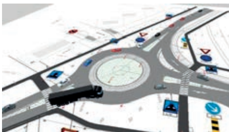
Slika 9. Prikaz kružnog raskrižja u VISSIM-u [14]

Pokazatelji koji su promatrani u okviru ovog rada su funkcionalni, ekološki i ekonomski pokazatelji. Funkcionalni pokazatelji koji su promatrani su maksimalna duljina kolone (m) i kašnjenje vozila (s/voz). Ekološki pokazatelji koji su promatrani su emisija ugljikovog monoksida (g/h), emisija dušikovog oksida (g/h) te emisija hlapivih organskih spojeva (g/h). Promatrani ekonomski pokazatelj je potrošnja goriva (galon/h).