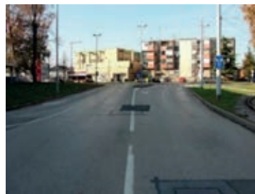
Slika 1. Vinkovačka cesta (sjever)[15] Slika 2. Gacka ulica (istok) [15]