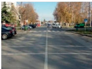
Slika 3. Vinkovačka cesta (jug) [15]

Geometrijske karakteristike promatranog raskrižja, pješačkih prijelaza i parkirnih mjesta prikazane su na Slici 4.