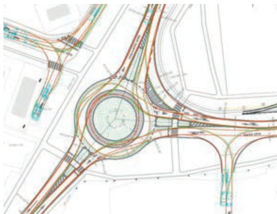
Slika 6. Provjera provoznosti [14]