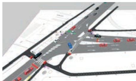
Slika 8. Prikaz semaforiziranog raskrižja u VISSIM-u [14]