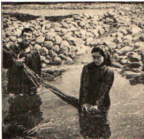
Slika 1. Močenje stabljike konoplje (Mendekić, 1946.)

Picture 1 Wet processing of hemp stem (Mendekić, 1946)