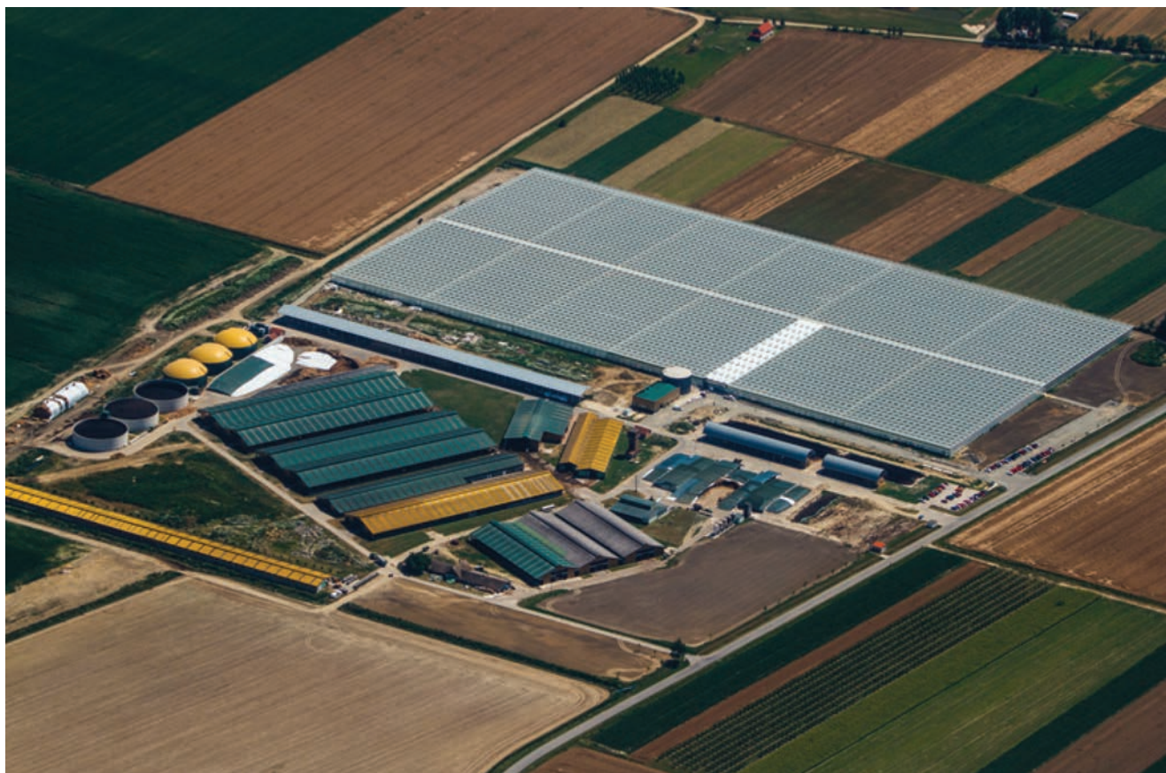
Slika 4. Bioplinsko postrojenje, istočna Hrvatska

znih tipova. Prvi dokument koji se bavi kvalitetom krajobraza u sklopu prostornog uređenja bila je studija Krajolik – Sadržajna i metodska podloga Krajobrazne osnove Hrvatske iz 1999. godine. Sljedeći dokument izdan je šesnaest godina poslije pod naslovom Krajolik kao kulturno nasljeđe (Dumbović Bilušić, 2015.). Ti dokumenti nemaju zakonodavnu snagu, no preporučuju se kao metodološka osnova prilikom analize i vrednovanja krajolika u Hrvatskoj. Iako je Hrvatska usvojila Konvenciju o europskim krajobrazima ( European Treaty Series 176 ) još 2000. godine, sa stupanjem na snagu 2004. godine, detaljna klasifikacija krajolika i izrada atlasa krajobraza do danas nisu provedeni. Aktualni dokument Strategija prostornog razvoja Republike Hrvatske usvojena 2017. godine (NN 106/17) kao cilj postavio je očuvanje identiteta prostora. Strateške aktivnosti obuhvaćaju i izradu Krajobraznog atlasa RH koji sadržajno treba obuhvatiti tipologiju krajobraza državnog teritorija na regionalnoj razini, definira-