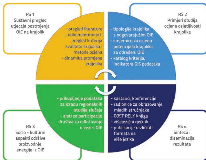
Slika 2. Shema organizacije projekta

Akcija COST RELY jest projekt čija je svrha stvaranje komunikacijske mreže pod okriljem EU-ova programa Obzor 2020, koji je trajao od listopada 2014. do listopada 2018. godine. Do kraja 2017. u COST-u je sudjelovalo više od 200