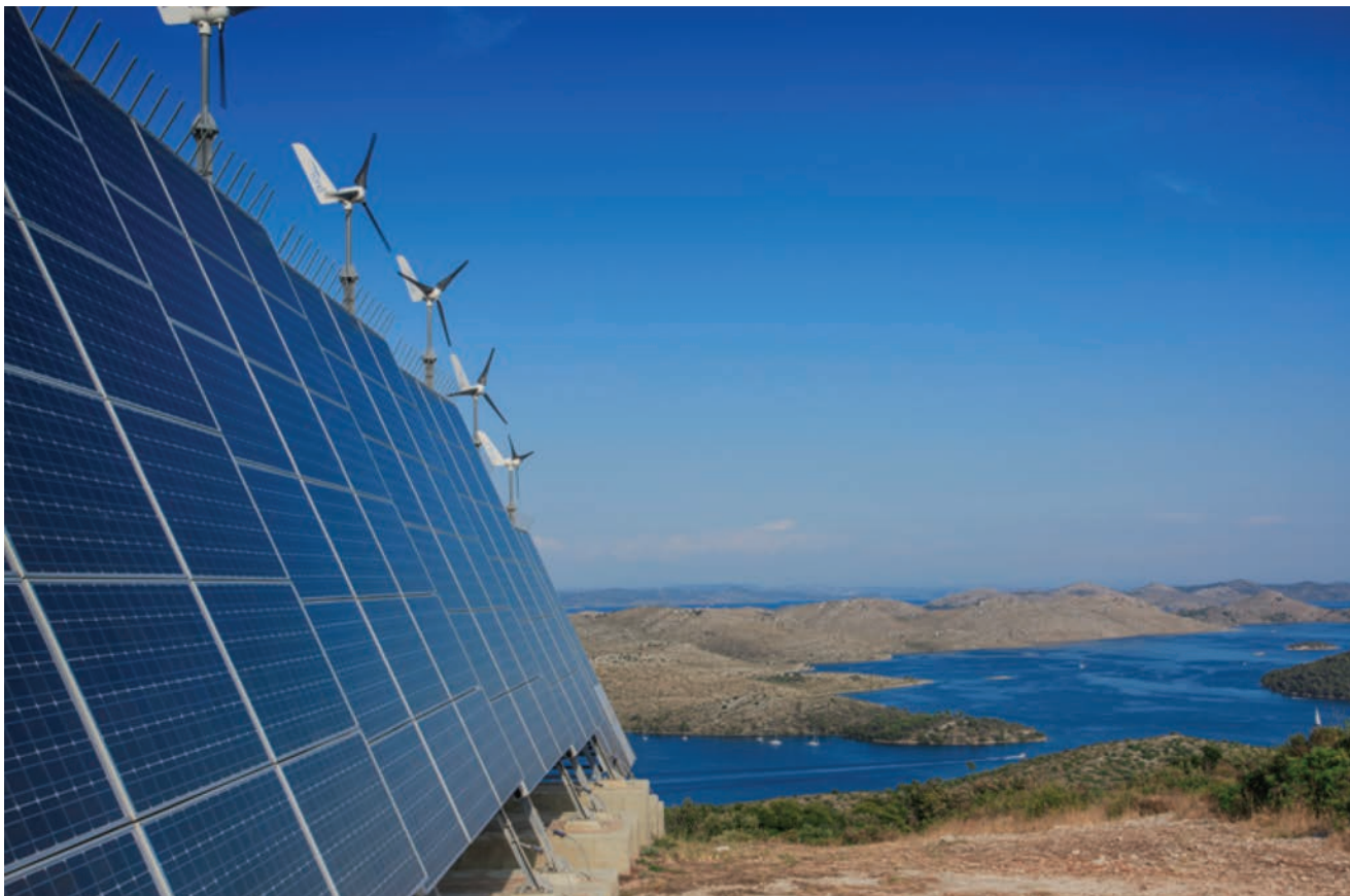
Slika 5. Fotonaponska elektrana, jadranska Hrvatska, autor: Romulić & Stojčić multimedia studio

ti ciljeve kvalitete krajobrazne regije te metodološke i radne smjernice za provedbu klasifikacije krajobraza na podregionalnoj razini. Inventura, tipološka klasifikacija i procjena krajobraza rijetko su provedeni na lokalnoj i regionalnoj razini. Teritorij i krajolik Republike Hrvatske zaštićeni su trima zakonodavnim okvirima u području zaštite prirode. Prvi je okvir pod okriljem ekološke mreže NATURA 2000, drugi je Zakon o zaštiti prirode (NN 80/13, 15/18), a treći Zakon o zaštiti kulturne baštine (NN 44/17), koji uključuje prirodnu baštinu i kulturne krajobraze. Trenutačno Natura 2000 obuhvaća 47 posto nacionalnog teritorija. Postoji 85 krajolika koji su zaštićeni kao značajni krajobraz ( http://www.mzoip.hr/hr/priroda/zasticena-podrucja.html ). Deset lokacija kulturnog krajolika zaštićeno je kao kulturno dobro, a još su dvije lokacije pod preventivnom zaštitom. Na UNESCO-ovu popisu svjetske baštine nalazi se kulturni krajolik Starogradsko polje na otoku Hvaru.