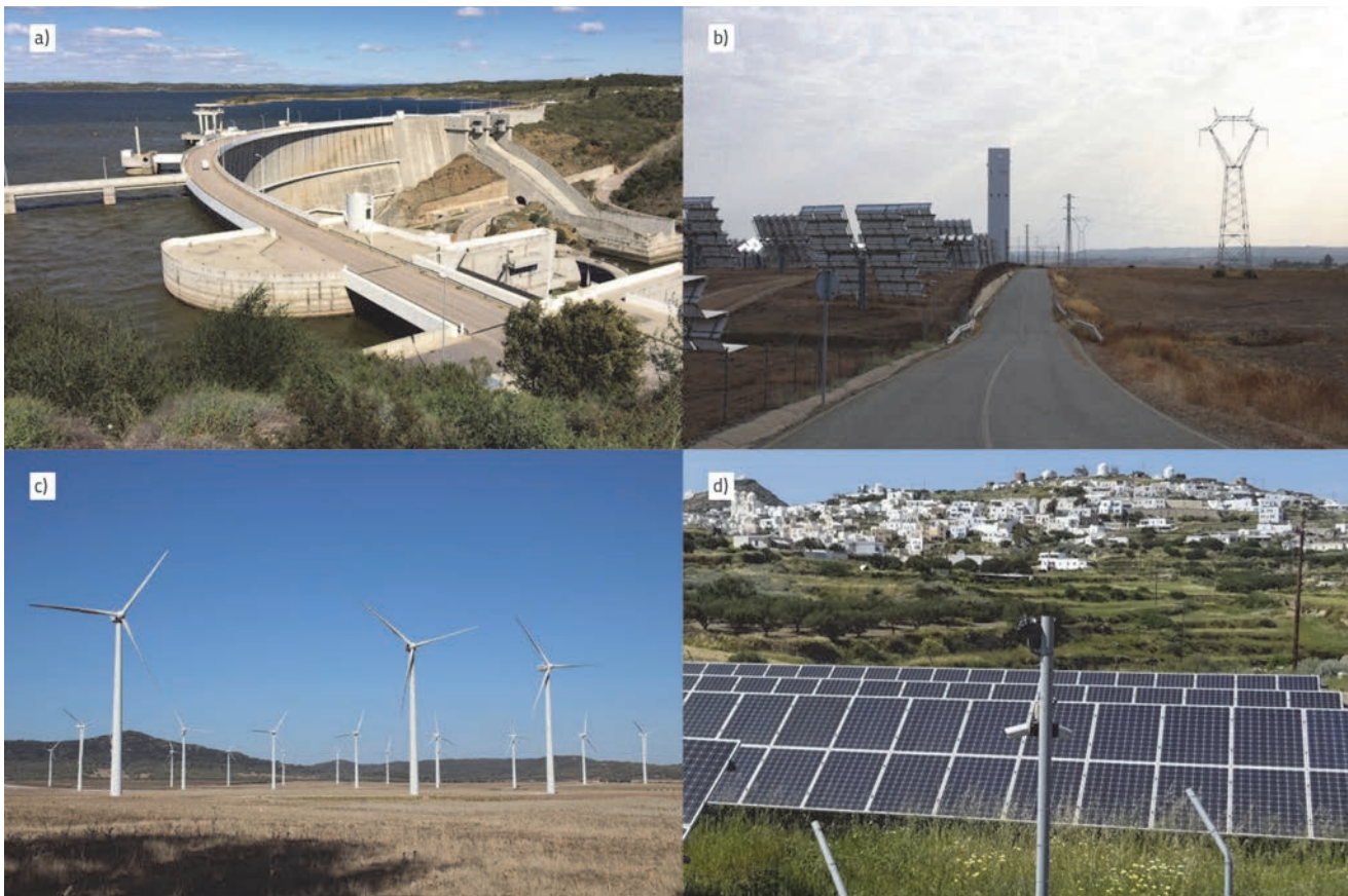
Slike 1.a – 1.d Primjeri krajobraza europskih zemalja koja oblikuju postrojenja obnovljivih izvora energije (Autorice Naja Marot, Alexandra Kruse)

Otvoreno pitanje ostaje kako postizanje tih ciljeva utječe na sveukupan prostor i