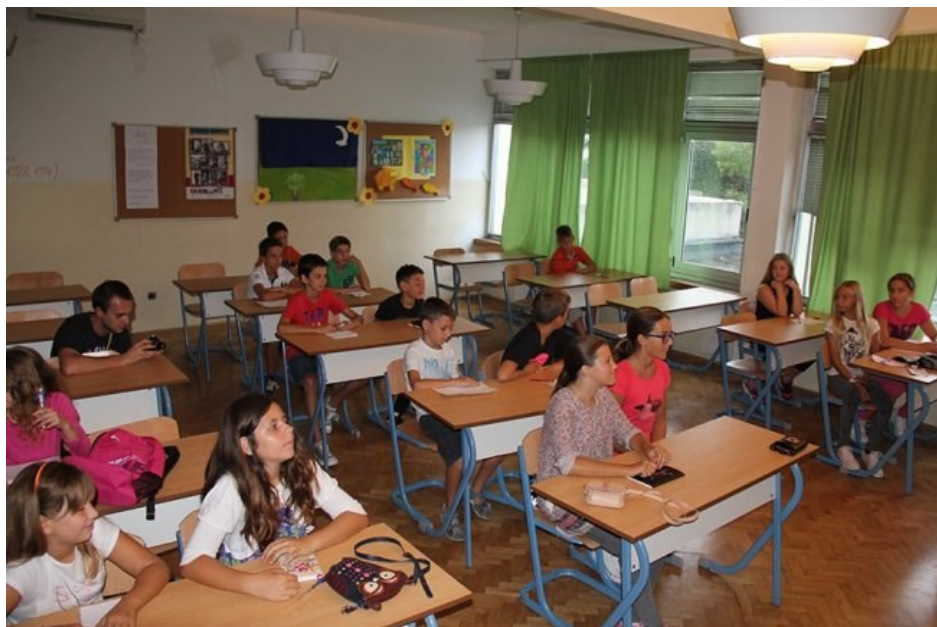
Slika 1. Tradicionalna učionica

pokušaje unaprjeđenja različitih struka - pedagoga, arhitekata, dizajnera školskog namještaja i drugih [2]. Učionice 19. stoljeća i prve polovice 20. stoljeća projektirane su s ciljem postizanja reda, discipline i školske higijene, čimbenika koji su smatrani preduvjetima dobrih edukacijskih praksi i pedagoških standarda (Slika 1). U njima nalazimo ploču, stolove i stolice za učenike, katedru za nastavnika, ormare za pohranu didaktičkih materijala i različite edukativne ilustracije po zidovima. Ploča služi kao žarište pažnje učenika i najvažniji je prostor transfera znanja u učionici.