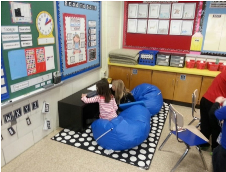
Slika 3. Personalizirano učenje u učionici 21. stoljeća

upotrebe novih tehnologija, njihov uspjeh i ocjene u velikoj mjeri ovise o tradicionalnom testiranju i rezultatima testova i ispita.