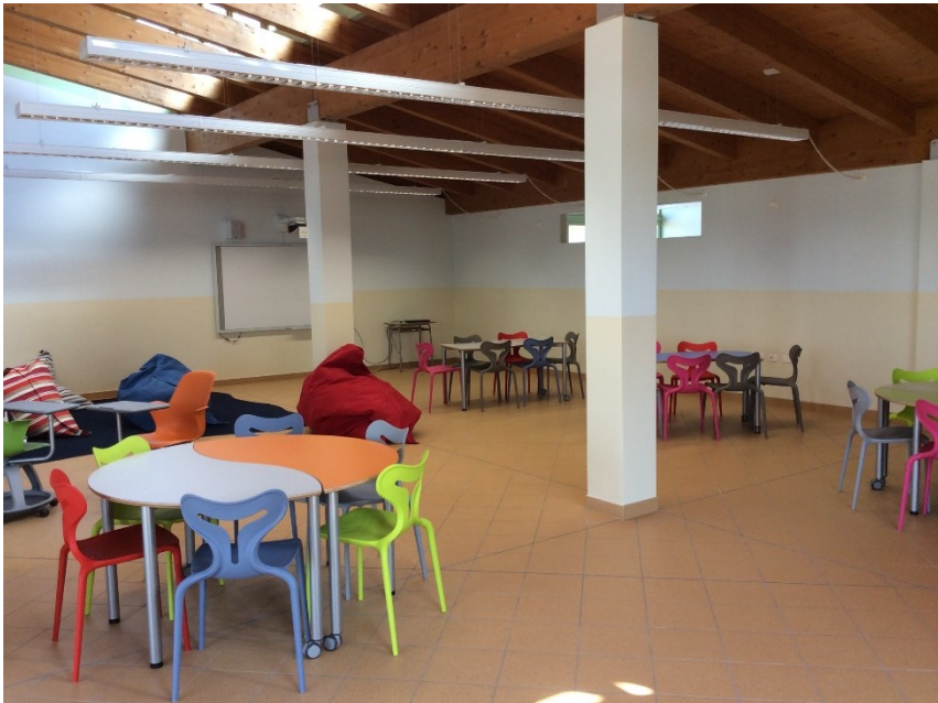
Slika 13. Prostori za učenje, Istituto Comprensivo di Cadeo e Pontenure