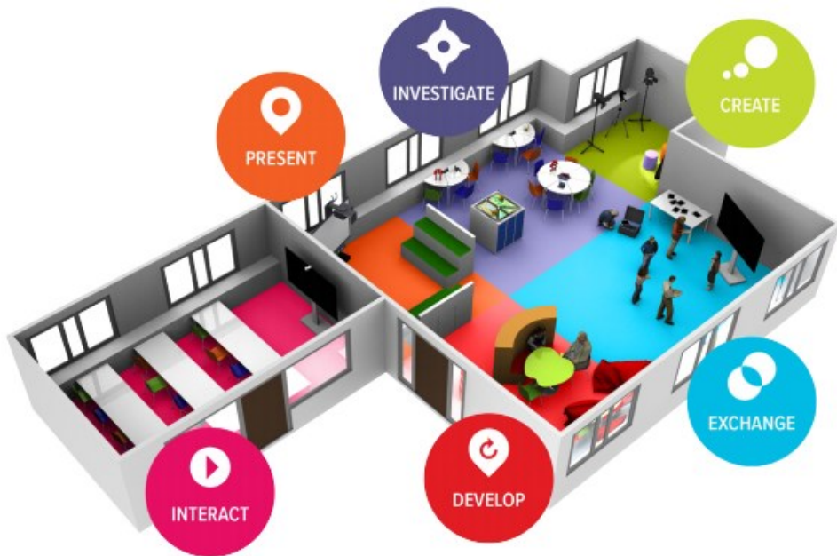
Slika 5. Šest zona učionice po Future Classroom Lab

U projektu Future Classroom Lab [9] definirano je šest zona učenja - istraživanje, kreacija, prezentacija, interakcija, razmjena, razvoj - i svaka je fokusirana na različite pristupe ili vidove učenja i podučavanja (Slika 5). Zoniranje omogućava vizualizaciju pedagoških scenarija u učionici i potiče „dobro učenje” opisano izjavama biti povezan, uključen i potaknut .