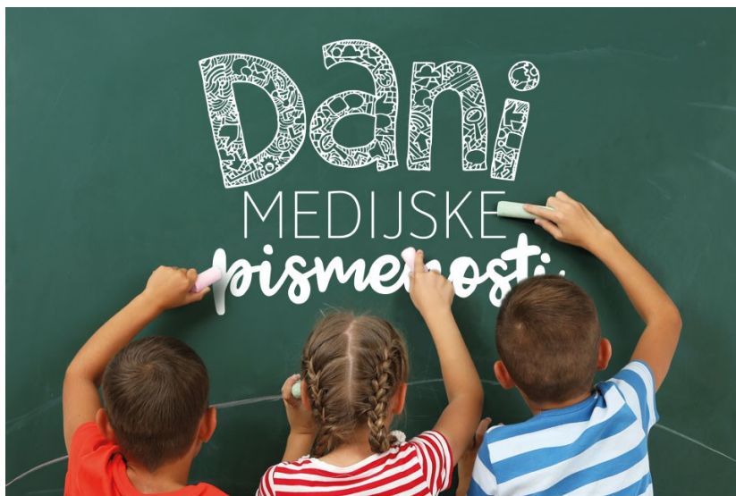
Slika 4. Komunikacijske vještine ključne za radnika 21. stoljeća

Pitanje je kako učenike naučiti ove vještine, kojim ih procesima provjeravati i u kakvom prostoru ih najlakše ostvariti.