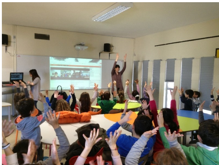
Slika 12. Prostori za učenje, Istituto Comprensivo di Cadeo e Pontenure