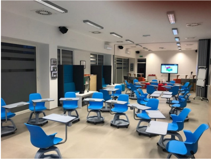
Slika 7. Učionica budućnosti, Srednja škola Ivanec

U Srednjoj školi Ivanec je u ožujku 2018. otvorena „učionica budućnosti“ kao jedna od 12 takvih učionica u Europi (Slika 7). Učionica je umrežena bežičnim internetom i posjeduje 25 laptopa, bežični 3D printer, skener i kopirni aparat, veliki interaktivni zaslon, virtualne naočale, setove za robotiku, kameru i fotoaparat. Po prije opisanom konceptu Future Classroom Lab, učionica je podijeljena u šest zona učenja namijenjenih razvijanju različitih načina učenja uz naglasak na interakciji, razvoju, kreiranju, istraživanju, prezentaciji i suradnji [12].