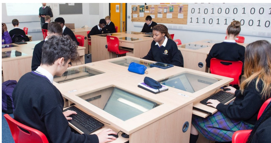
Slika 9. Prostori za učenje, škola Le Chéile, Irska