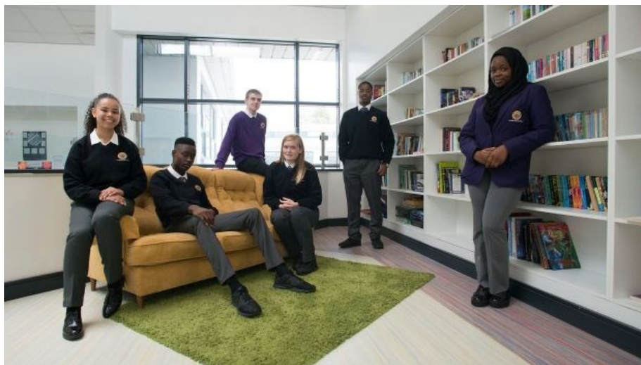
Slika 8. Prostori za učenje, škola Le Chéile, Irska