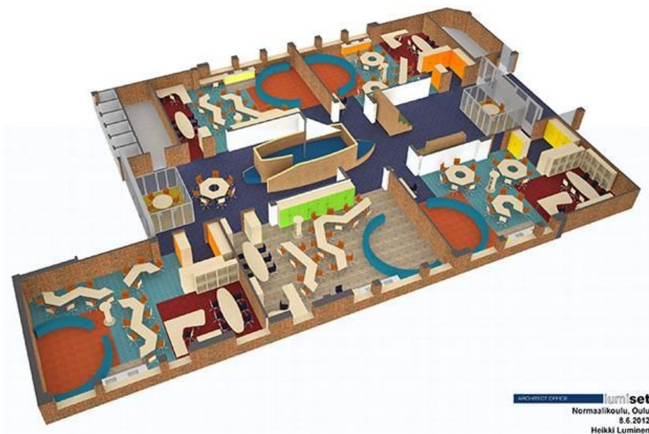
Slika 6. Organizacija prizemlja UBIKO škole, Finska

Neki radikalniji projekti „ruše“ zidove učionica i definiraju ih pomoću namještaja (ormara, tepiha, stolica) kao funkcionalne, meko ograničene cjeline (primjer UBIKO škole na Sveučilištu Oulu u Finskoj) [2]. Učenici na nastavu donose vlastite laptove ili tablete i povezuju se bežičnom vezom u svim dijelovima prostora (Slika 6).