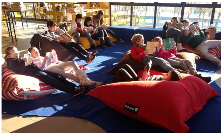
Slika 11. Prostori za učenje, Istituto Comprensivo di Cadeo e Pontenure