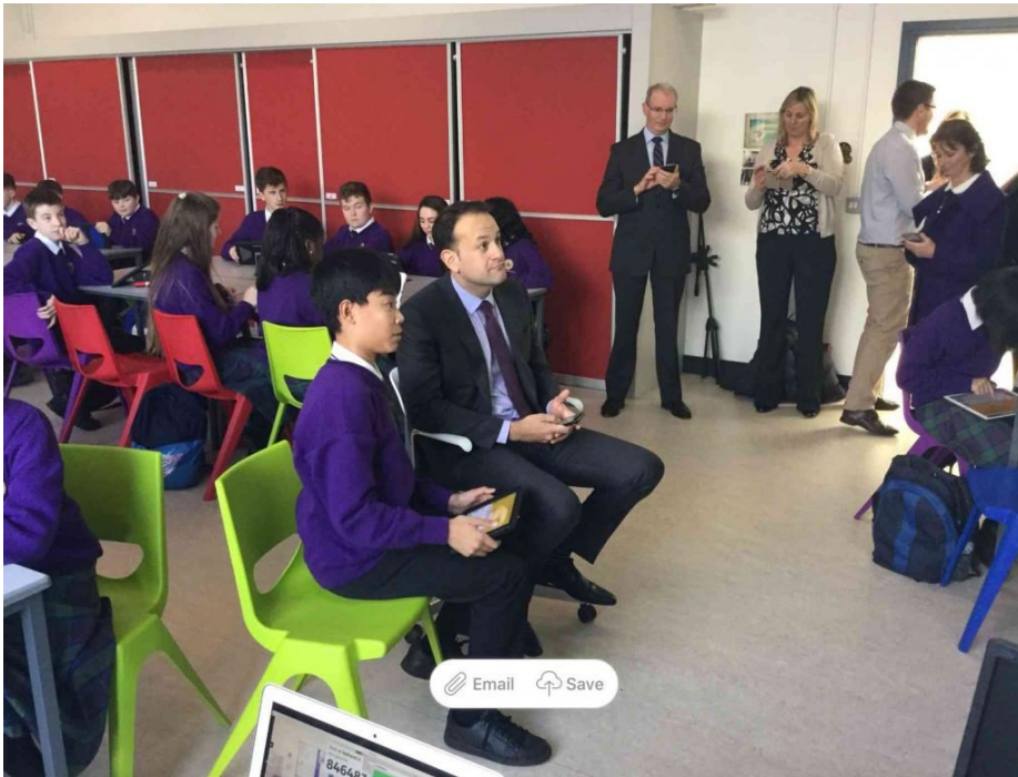
Slika 10. Prostori za učenje, škola Le Chéile, Irska