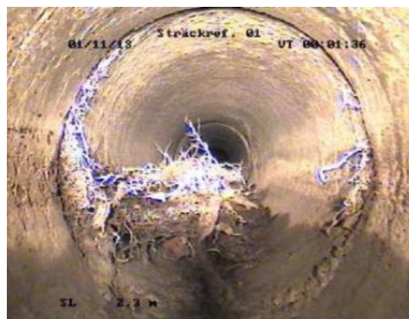
Slika 1. Korijenje koje je prodrlo kroz spoj dvije cijevi [22]

razine podzemne vode nemaju problema s prodorom korijenja [20]. Štete koje se pojavljuju na cijevima, zbog djelovanja korijenja, mogu bit različite: mogu oslabiti spojevi između cijevi, promijeniti se nagib cijevi, pojaviti pukotine, itd. Općenito je dosta rijetko da korijenje ošteti dobro postavljenu i održavanu kanalizacijsku cijev [21].