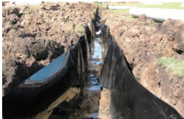
Slika 2. Barijera postavljena u rov cijevi [29]

Također, postoje i različite barijere za korijenje u obliku geotekstila ili geomembrane (slika 2), međutim to je dosta skupo rješenje i teško ga je postaviti kada su cijevi već postavljene [25].