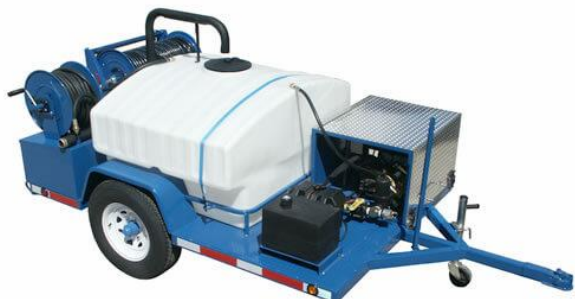
Slika 10. Visokotlačni čistač za čišćenje kanalizacije [41]

te ga je svaki put sve teže ukloniti [18]. Mehanički način uklanjanja koristi se samo za hitno uklanjanje korijenja u slučaju začepljenja cijevi.