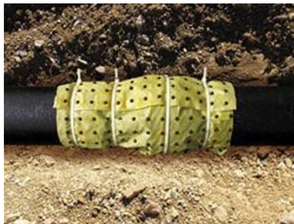
Slika 3. Geotekstil s herbicidom postavljen na spoju dvije cijevi [31]

Ostale barijere koje mogu spriječiti korijenje je dobro zbijeni sloj tla, kemijska zaštita, različite barijere od plastike ili metala [25]. U novije vrijeme pojavljuje se tkanina (geotekstil) koja ima granule koje polagano otpuštaju herbicid (slika 3) i prsten za brtvljenje (brtva) koji sadrži herbicide koje uništavaju korijen [30].