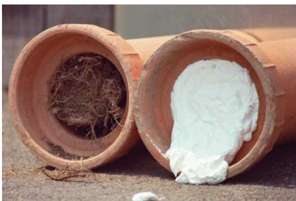
Slika 12. Cijev puna korijenja i pjena u cijevi [43]

Kemijski način uklanjanja korijenja je pomoću različitih kemikalija. Kemijske tvari koje uništavaju biljke nazivaju se herbicidi. Kod korištenja herbicida treba obratiti pažnju na to da oni mogu uništiti cijelu biljku ili samo njezin dio na koji je primjenjen herbicid.