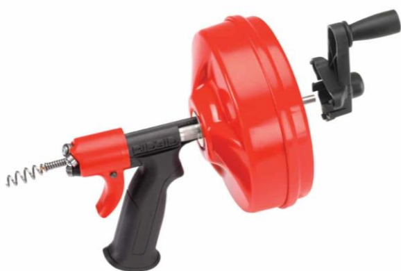
Slika 8. Alat za čišćenje kanalizacije sa sajlom na ručni pogon [38]

Mehanička kontrola podrazumijeva korištenje različitih alata i naprava koji režu i uklanjaju korijenje iz kanalizijskih cijevi. To je najviše korištena i najvažnija metoda nekemijskog uklanjanja [16, 18].