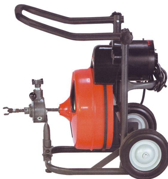
Slika 9. Stroj za čišćenje kanalizacije sa sajlom i oštricom [40]

Strojevi s oštricom su savitljivi čelični kablovi sa postavljenom oštricom ili svrdlom na vrhu kabla koje na taj način odstranjuje korijenje (slika 9) [16, 18, 39].