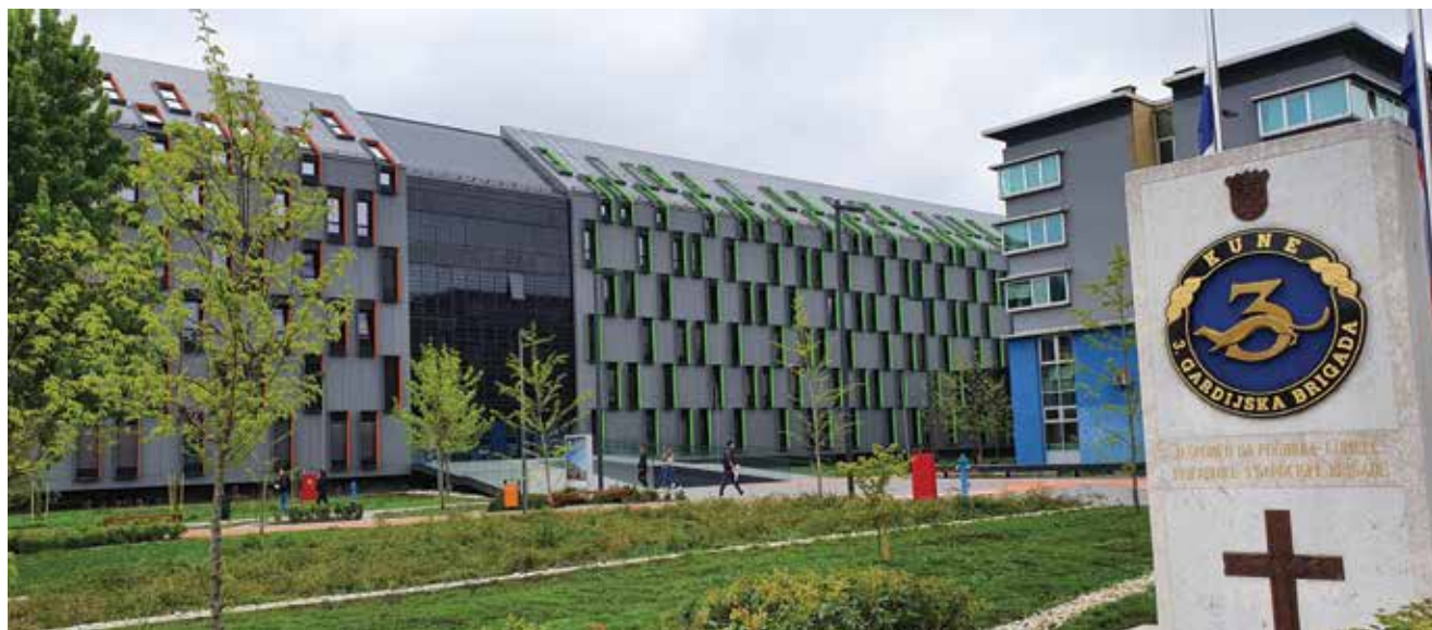
Pogled na dio novog kampusa u Osijeku

Nakon detaljnih usklađivanja i izmjena prvotnoga rješenja, zajedno s projektom konzervacije i predstavljanja arheološkog rješenja 2011., dobivena je potvrda glavnoga projekta i održano svečano otvorenje radova, koji su završeni 2016.