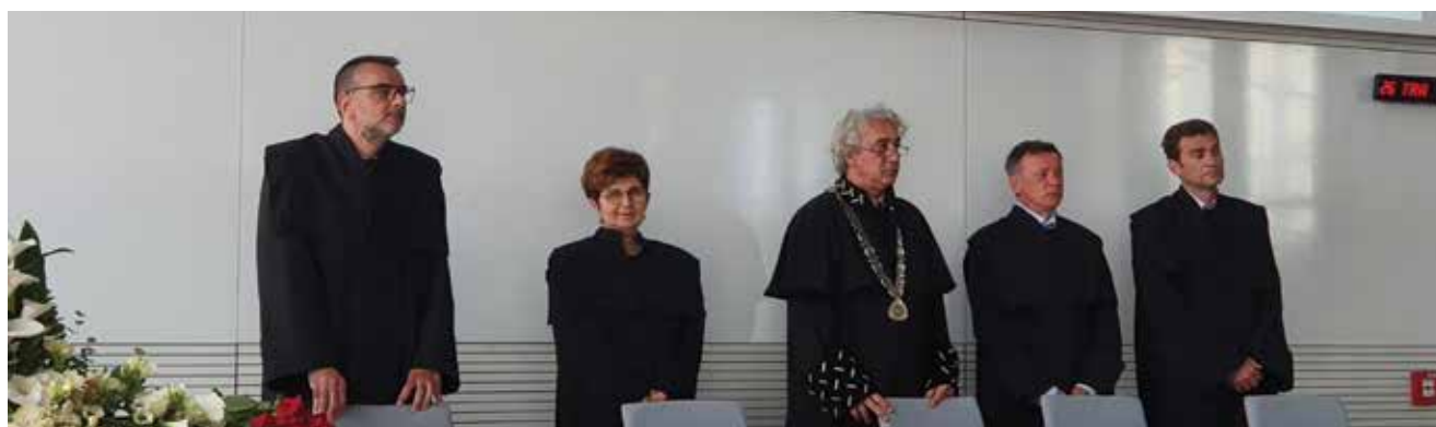
Sudionici svečane Akademije povodom 45. obljetnice u Osijeku