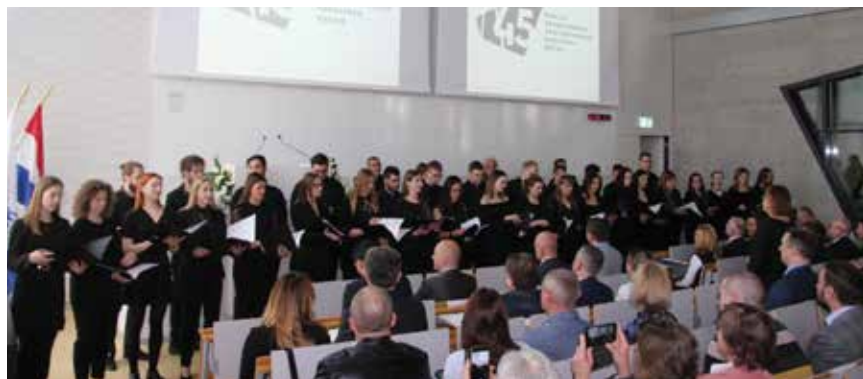
Nastup zbora Sveučilišta Josip Juraj Strossmayer