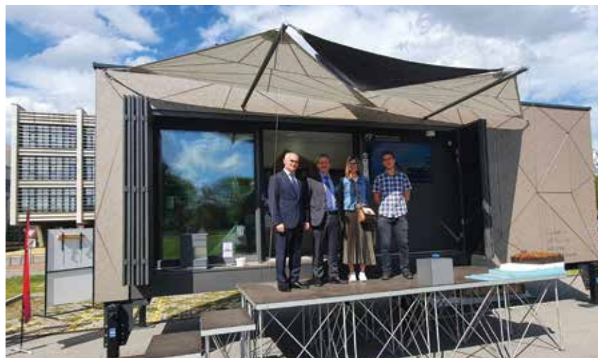
Mobilna nZEB kuća nazvana MUZA