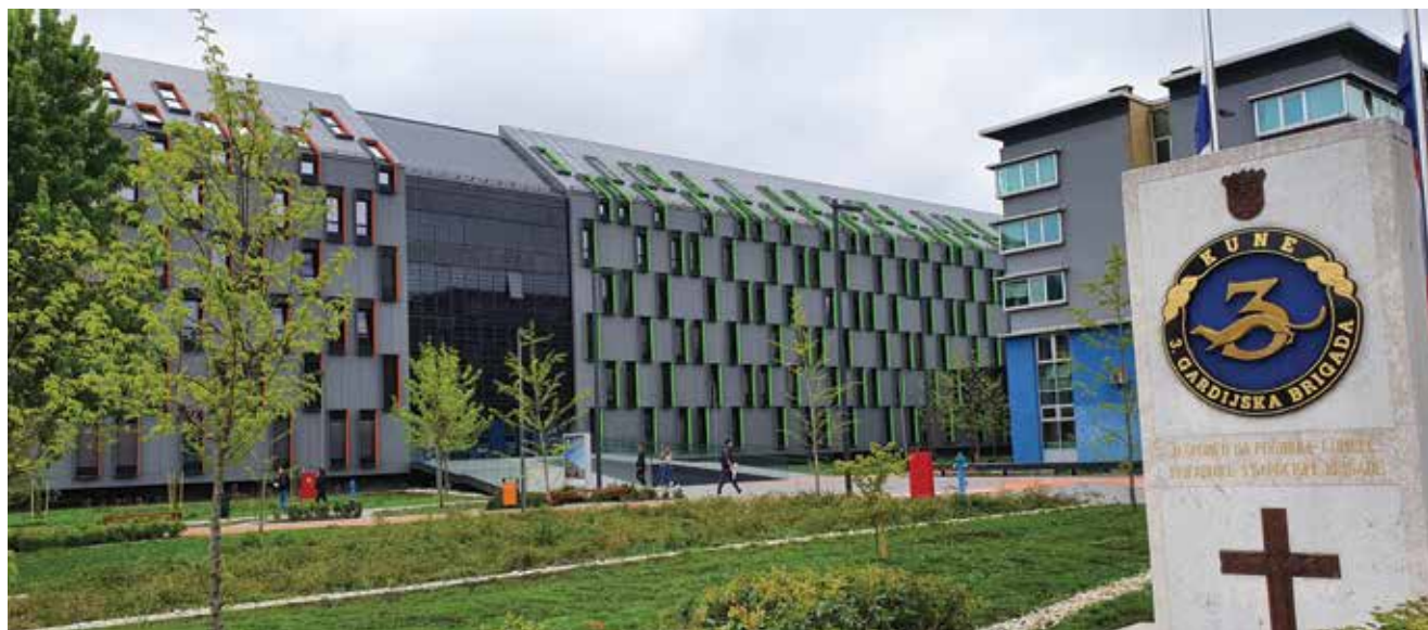
Pogled na dio novog kampusa u Osijeku

Nakon detaljnih usklađivanja i izmjena prvotnoga rješenja, zajedno s projektom konzervacije i predstavljanja arheološkog rješenja 2011., dobivena je potvrda glavnoga projekta i održano svečano otvorenje radova, koji su završeni 2016.