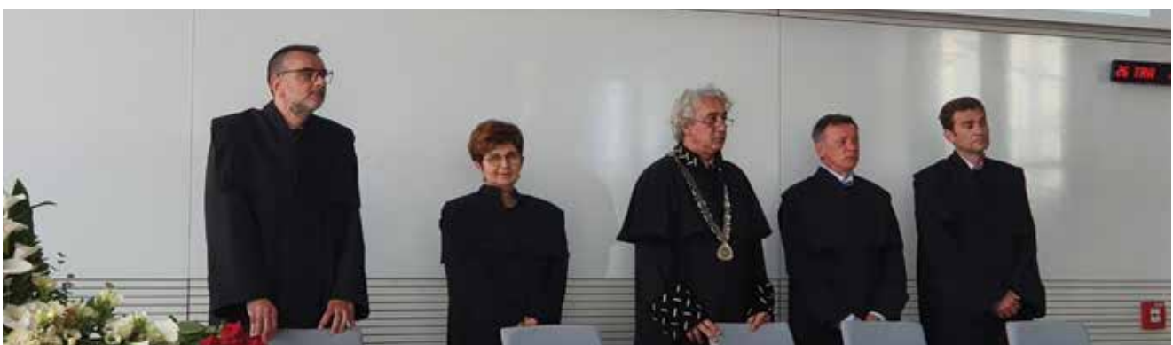
Sudionici svečane Akademije povodom 45. obljetnice u Osijeku