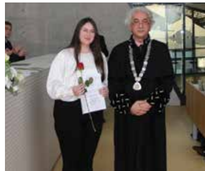
Dodjela priznanja najboljim studentima