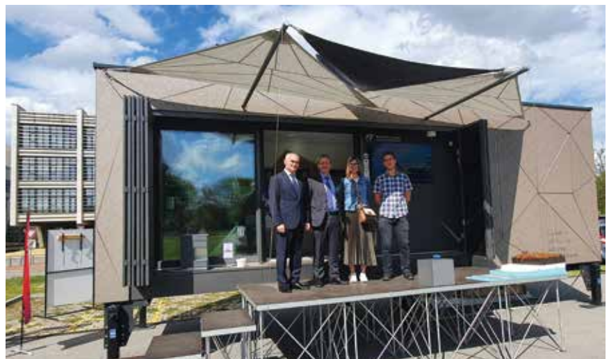
Mobilna nZEB kuća nazvana MUZA

Izvori: https://radio.hrt.hr , https://stv.hr Fotografije: Krešimir Pavelić