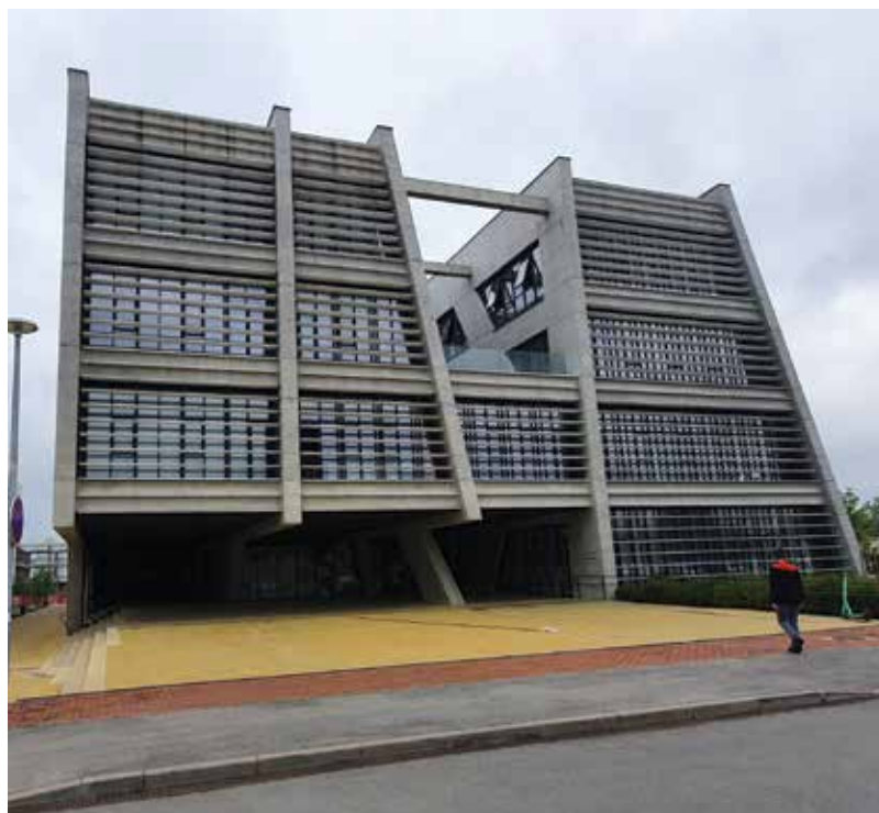
Moderna zgrada Fakulteta građevinarstva i arhitekture završena je 2016. godina

Rješenje problema neodgovarajućih prostornih uvjeta i djelovanja na dvije lokacije, uz istodobno povećavanje broja studenata i studijskih programa, također je pronađeno u sklopu novoga Sveučilišnog kampusa koji se u fazama gradi od 2005. na prostoru bivše vojarne Drava . Pripreme za gradnju zgrade Građevinskog fakulteta u Osijeku započele su 2005. Nedugo su potom na lokaciji započela dodatna arheološka istraživanja koja su nalagala izmjenu idejnoga projekta radi zaštite pronađenih rimskih ostataka.