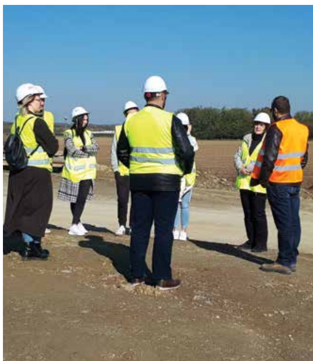
Gradilište dionice autoceste A5 Beli Manastir – Osijek – Svilaj, poddionica Most Halasica – Beli Manastir, listopad 2021.

ca koji su sudjelovali u projektu prešao broj od 1200 sudionika. Najvažniji segment toga impresivnog broja čini ipak 250 studenata i 106 poslodavaca koji su zajedno provodili stručnu praksu. Najveći broj stručnih praksi realiziran je na području Osječko-baranjske županije (59 %), Grada Zagreba i Zagrebačke županije (15 %) te Vukovarsko-srijemske županije (14 %). Prema izvješćima mentora, poslovi koje su studenti obavljali tijekom stručne prakse (projektant suradnik, pomoćnik inženjera gradilišta, pomoćnik nadzornoga inženjera, suradnik voditelja projekta, rad u ispitnome laboratoriju) pokrivaju i opće i specifične ishode učenja stručne prakse, što upućuje na zaključak da su poduzeća u kojima su studenti obavljali praksu primjereni za postizanje ishoda učenja te da su mentori dobro pripremljeni i motivirani. Njihova su zajednička iskustva, prikupljena iz anketa, zapisa u dnevnicima stručne prakse, evaluacijskih obrazaca i razgovora, toliko pozitivna i motivirajuća da su i prije završetka projekta potaknula intenzivno umrežavanje Fakulteta i tržišta rada.