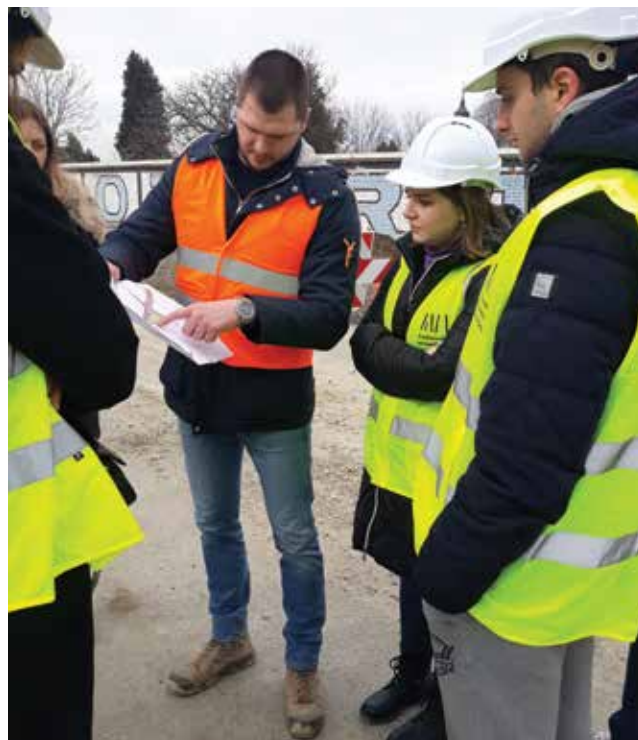
Gradilište podvoznjaka u Ulici Sv. L. B. Mandića u Osijeku, veljača 2022.