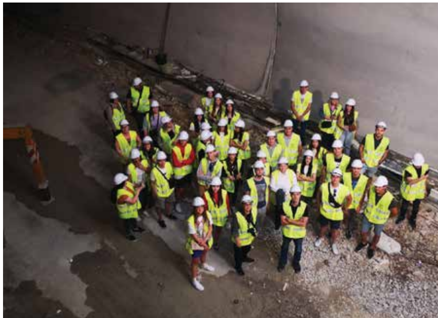
Gradilište tunela Podmurvice na državnoj cesti DC403, lipanj 2022.

stekli tijekom stručne prakse te pozitivnih komentara mentora nameće se zaključak da je takav model stručne prakse održiv, koristan i primjenjiv. Rezultati provedenoga istraživanja sugeriraju da bi u budućnosti bilo korisno unaprijediti