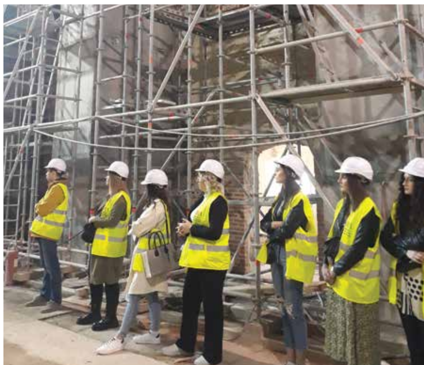
Gradilište obnove crkve sv. Franje Asiškog u Zagrebu, travanj 2022.

Šest mjeseci po završetku projekta PRAG,