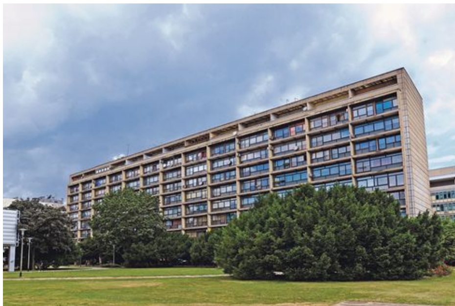
Slika 3 – Drago Galić: Višestambena zgrada u Zagrebu, Ulica grada Vukovara 43, 43a; 1959.

Na ovoj drugoj zgradi opet su studiozno postavljeni betonski brise-soleil 3 južne fasade, proračunati prema upadu zraka sunca (kao uostalom i parapeti velikih staklenih stijena dnevnoga boravka i južne spavaće sobe), perforirani poput kakve uske betonske pergole. Međutim, dok je Le Corbusierov Unite afirmacija egzemplarne plastike betona, projektiran istovremeno iznutra i izvana, u kojemu dodani prefabrikati (betonski brise-soleili , stubišta...) ne ruše konzistentnost cjeline, Galićeva struktura s neovisnim južnim pročeljem djeluje poput iznutra projektiranoga stroja koji je zatvoren s četiri tanke, vitke plohe, i to je već na prvi pogled uočljiva razlika i od prve zgrade i od Marseillea [2].