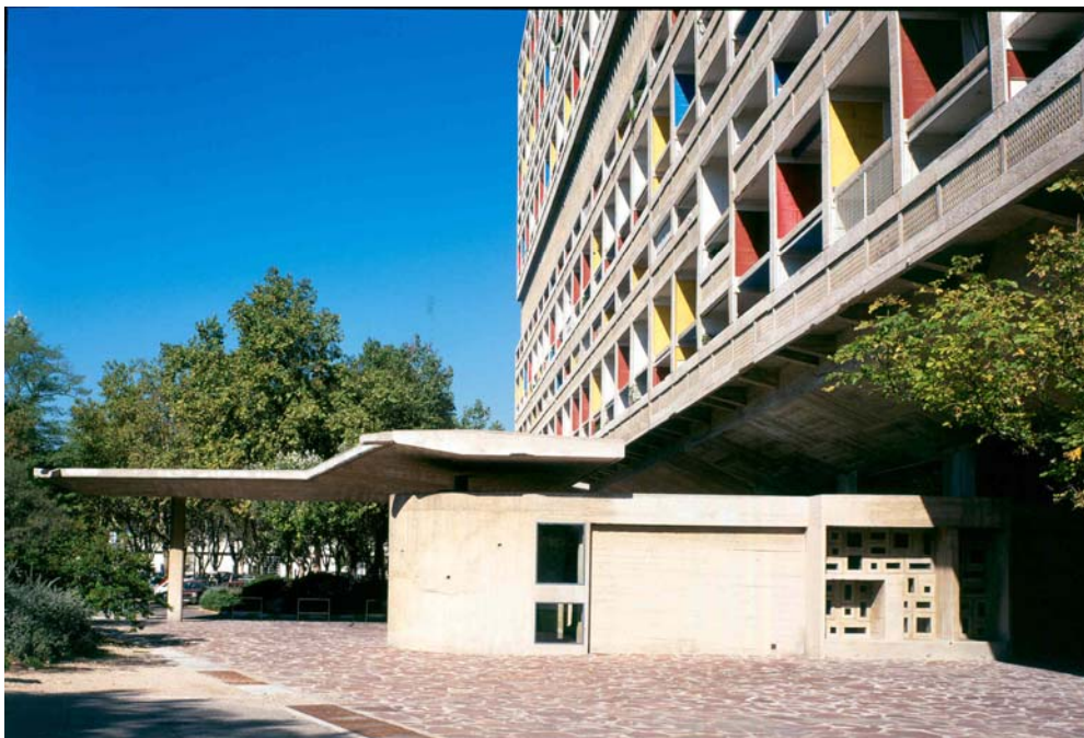
Slika 4 – Le Corbusier: Unité d'habitation de Marseille, Marseille, 289 Boulevard Michelet; 1952.

Marseilleski Unité (slika 4) ima 337 stanova u 23 tipa, od hotelske sobe do stana za obitelj s 4 do 8 djece, koji ukupno ima pet spavaćih soba i standardan dnevni prostor s kuhinjom (jednak za sve dvoetažne stanove). Širina raspona stupova u prizemlju je 8,38 metara osno (16 rastera), a taj je raspon u gornjim etažama prepolovljen – 4,19 metara (32 rastera). Čitava zgrada ima jedan ulaz sa središnjim stubištem i liftovima, smještenim na južnoj polovici, te dva evakuacijska stubišta i dva za vatrogasce, koji su međusobno raspoređeni na udaljenosti od 44 metra (polumjer 22 m), što je dalo relativno složen tlocrt prizemlja karakterističnog po jednoličnome rasporedu stupova osnovne nosive konstrukcije. U literaturi je najčešće referiran tip stana s tri spavaće sobe u varijanti sa spavanjem gore ili dolje, ovisno ide li se iz ulaznoga prostora u spavaći dio gore ili dolje [2,6]. Dnevni prostor dvostruke visine je smješten u spavaćoj etaži, galerijski je otvoren prema gornjoj, ulaznoj etaži i od roditeljske spavaće sobe odvojen pregradnim paravanom, tako da spavaća soba dobiva dnevno svjetlo preko vertikalnih, uskih otvora u paravanu.