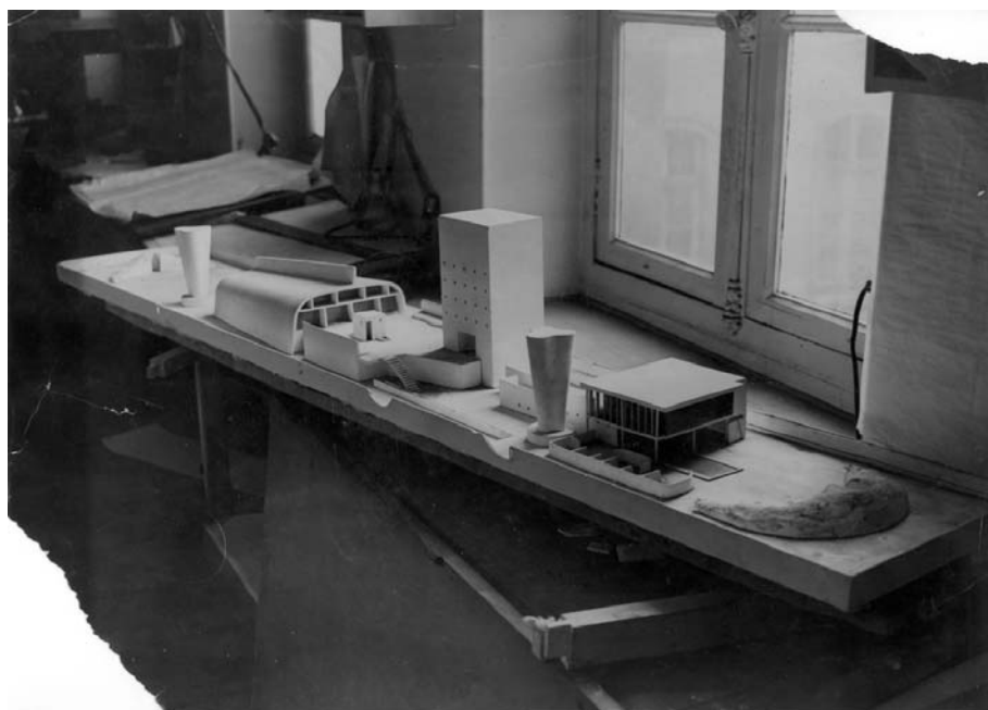
Slika 5 – Le Corbusier: maketa krovne terase marseilleskog Unitéa, početkom 1950-ih [6]

Na najvišem, sedamnaestom katu, smješteno je odmaralište za stanare – velika zajednička krovna terasa (slika 5). Jedna rampa vodi direktno na krovnu terasu gdje se nalazi, postavljena na tankim stupovima, prostorija za odmor, plitki bazen i nekoliko dječjih igrališta. Druga strana krovne terase, velike 24 x 165 metara, određena je za rekreaciju odraslih. Ovdje se nalazi dvorana za sportske aktivnosti i sportski teren, dok na sjevernom kraju velika betonska ploča služi kao zaštita od jakog sjevernog vjetrova, maestrala, a istovremeno služi kao pozadina za krovnu pozornicu.