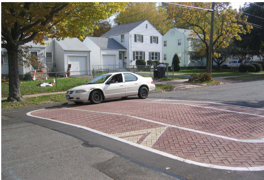
Slika 5 - Izdignuće na kolniku izvedeno kombinacijom asfalta i betonskih elemenata [7]

Uz sve navedene mogućnosti smirivanja prometa, i dalje se razmišlja o učinkovitim i jeftinim načinima smirivanja prometa pa je tako jedno neuobičajeno, a zanimljivo rješenje moguće vidjeti u manjim austrijskim mjestima gdje je ispred pješačkih prijelaza i škola postavljen dvodimenzionalni lik policajca u pravoj veličini.