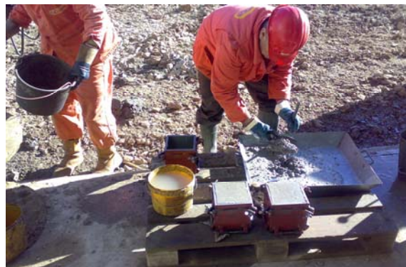
Slika 2. Uzimanje uzoraka za ispitivanje tlačne čvrstoće