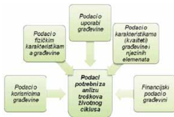
Slika 3. Skupine podataka potrebnih za provedbu analize troškova životnog ciklusa [21]

Više je razloga za nepostojanje jedinstvenog modela izračuna troškova životnog ciklusa, a neki su od njih svakako postojanje različitih sustava prikupljanja i obrade podataka o troškovima održavanja i uporabe građevine te postojanje vrlo različitih