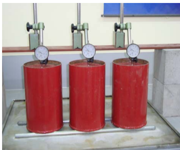
Slika 1. Postupak ispitivanja

sitne i krupne frakcije svih agregata. Radi se o nenormiranom postupku koji je podrazumijevao praćenje pomaka agregata (sitnog i krupnog odvojeno) u posudama visine 25 cm i promjera 15 cm (slika 1.). Na materijal u posudama slobodno su postavljeni perforirani poklopci. Uzorak materijala povremeno je zalijevan vodom (u 0-tom, 47-mom i 95-om satu) koja je imala mogućnost slobodnog procjeđivanja kroz uzorak i perforirano dno posude. Mikrouricama koje su bile u kontaktu s poklopcima (smještenim na uzorcima) praćeni su pomaci materijala zbog promjene njegove vlažnosti.