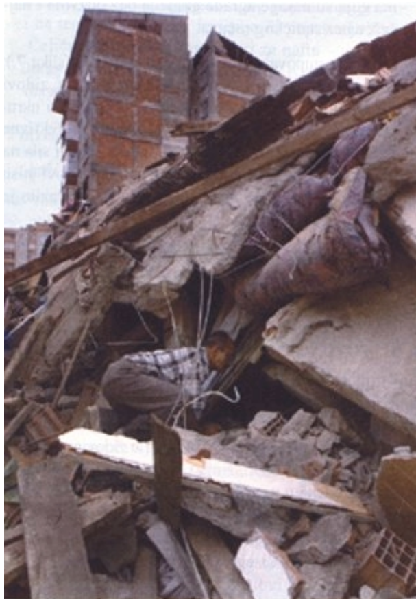
Slika 12. Oštećenja loše izvedene zgrade u bloku sa dobro izvedenim zgradama

Da bismo učili na tuđim pogreškama i izbjegli neugodna iskustva kao što su ova iz potresa 1999. godine, nužno bi bilo prije potresa detektirati i zatim pojačati potencijalno opasne objekte. Zato bi trebalo napraviti pregled