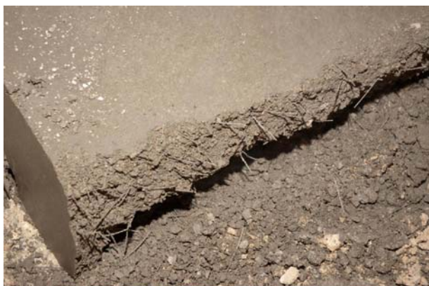
Slika 3. Izgled poprečnog presjeka MAMB-a