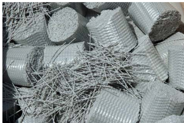
Slika 1. Makrosintetička vlakna Enduro 600

U stručnoj i znanstvenoj literaturi dosta se pisalo o vlaknima i mikroarmiranom betonu, ali, kao što je u uvodu spomenuto, makrosintetička vlakna najnovije su dostignuće diskontinuirane armature čiju primjenu tek treba provjeriti. Ovaj će se rad koncentrirati na makrosintetička vlakna tržišnog imena Enduro 600 (slika 1.) te njihovu primjenu na izradi probne dionice u tunelu Puljani, na spojnoj cesti čvor Ploče – Luka Ploče, autoceste A10, granica BiH – Ploče.