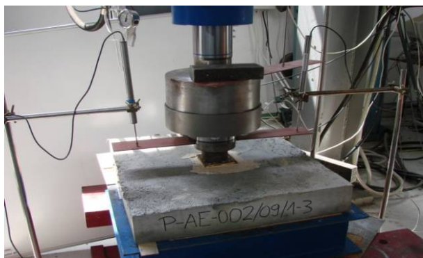
Slika 6. Ispitivanje utroška energije za normirani progib uzorka MAMB