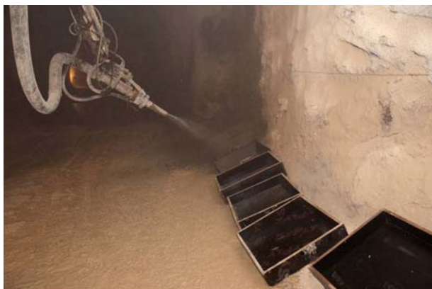
Slika 2. Izrada uzoraka MAMB in situ