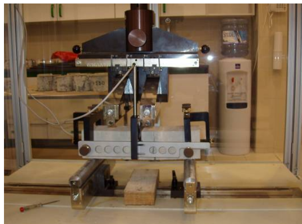
Slika 4. Ispitivanje postpukotinske nosivosti MAMB-a

Kad naprezanja u betonu dosegnu vlačnu čvrstoću betona, nastaju pukotine u betonu te na tim mjestima naprezanja preuzimaju vlakna. Porastom deformacije rastu oštećenja u raspucanoj zoni, a ostali dijelovi uzorka se rasterećuju.